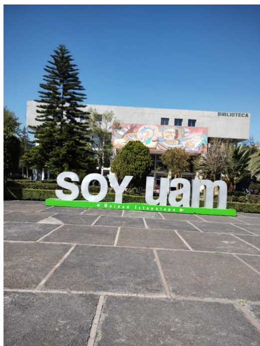
Figura 4: Letras de la UAM, punto de encuentro.

poca gente, por lo que pensamos que era un lugar ideal para escuchar las participaciones de cada uno, nos sentamos en el pasto formando un círculo, nosotras como equipo de investigación quedamos en medio, de esa forma podíamos ver bien a todos los participantes, y quedamos a buena distancia.