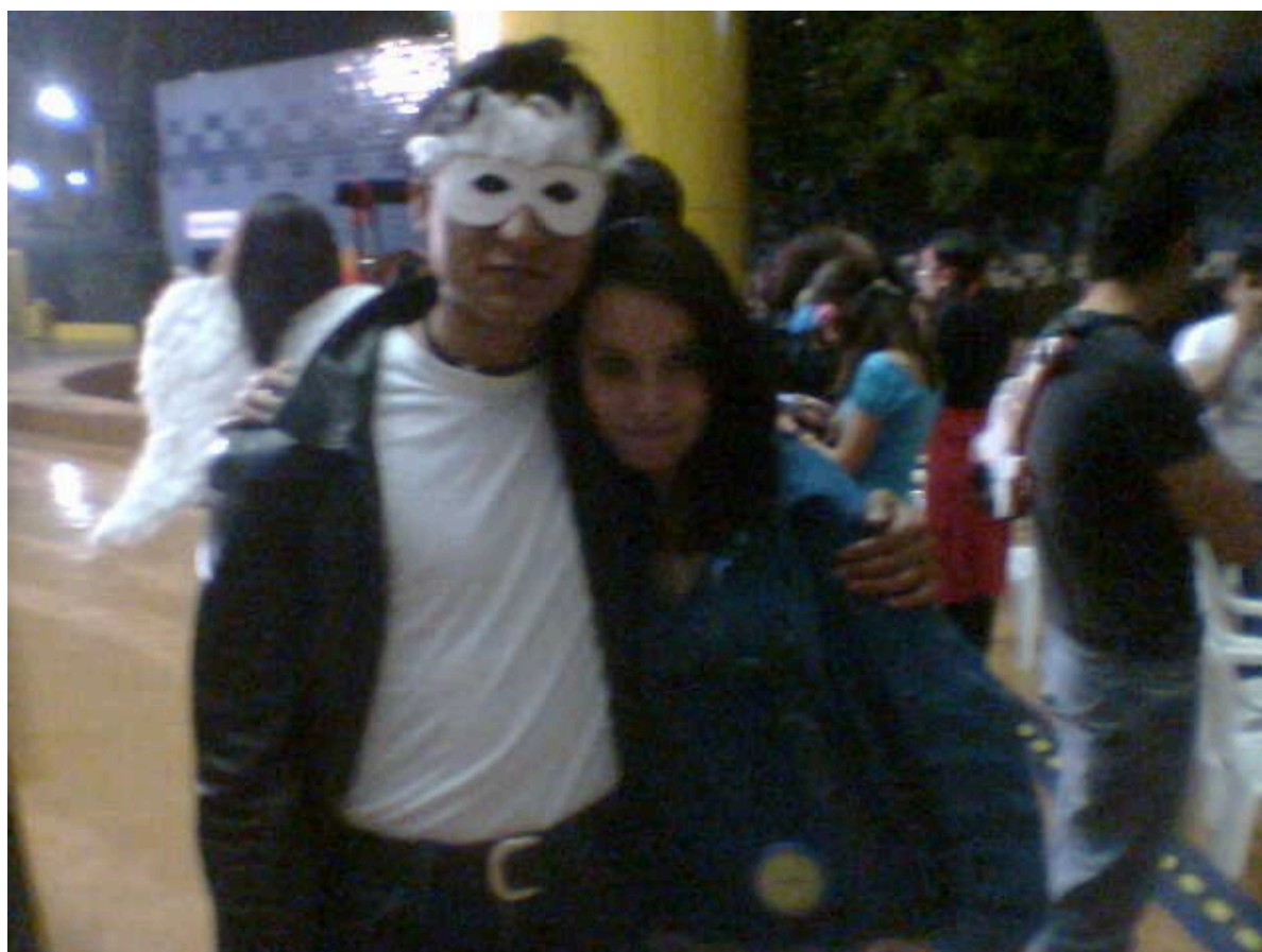
Fiesta de despedida Generación 34, estilo rock and roll