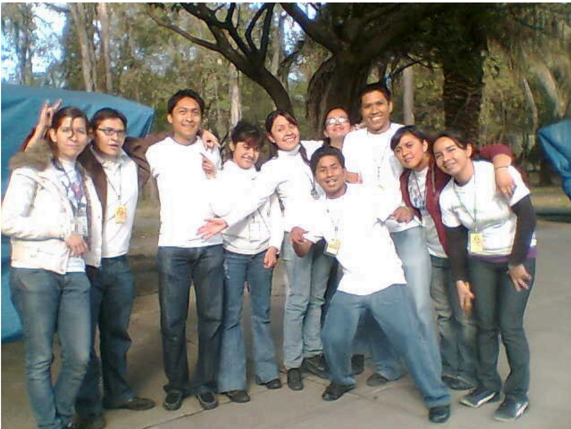
Descanso entre turnos, entre los puestos ambulantes de la primera sección de Chapultepec