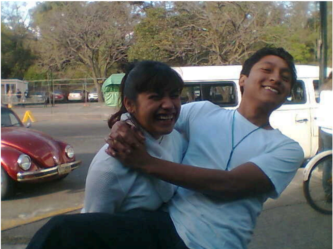
Jugando un rato con los chicos del programa de primer empleo para personas con discapacidad intelectual