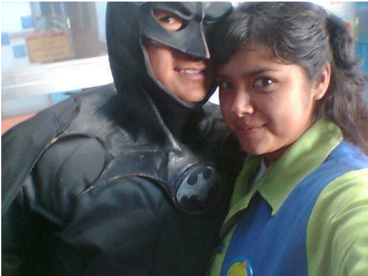
Batman, apunto de recibir a niños de escasos recursos