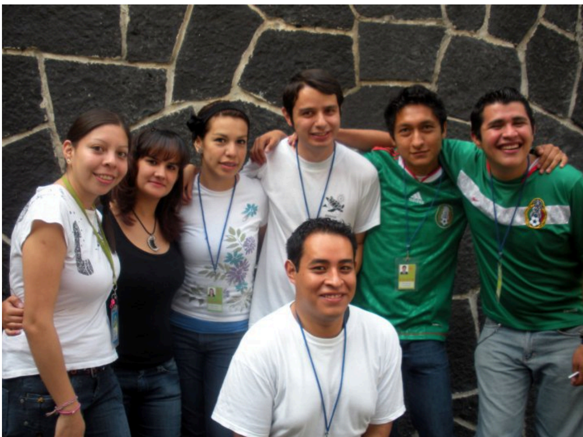
Cuates de Comunico viendo el partido de futbol del mundial 2010