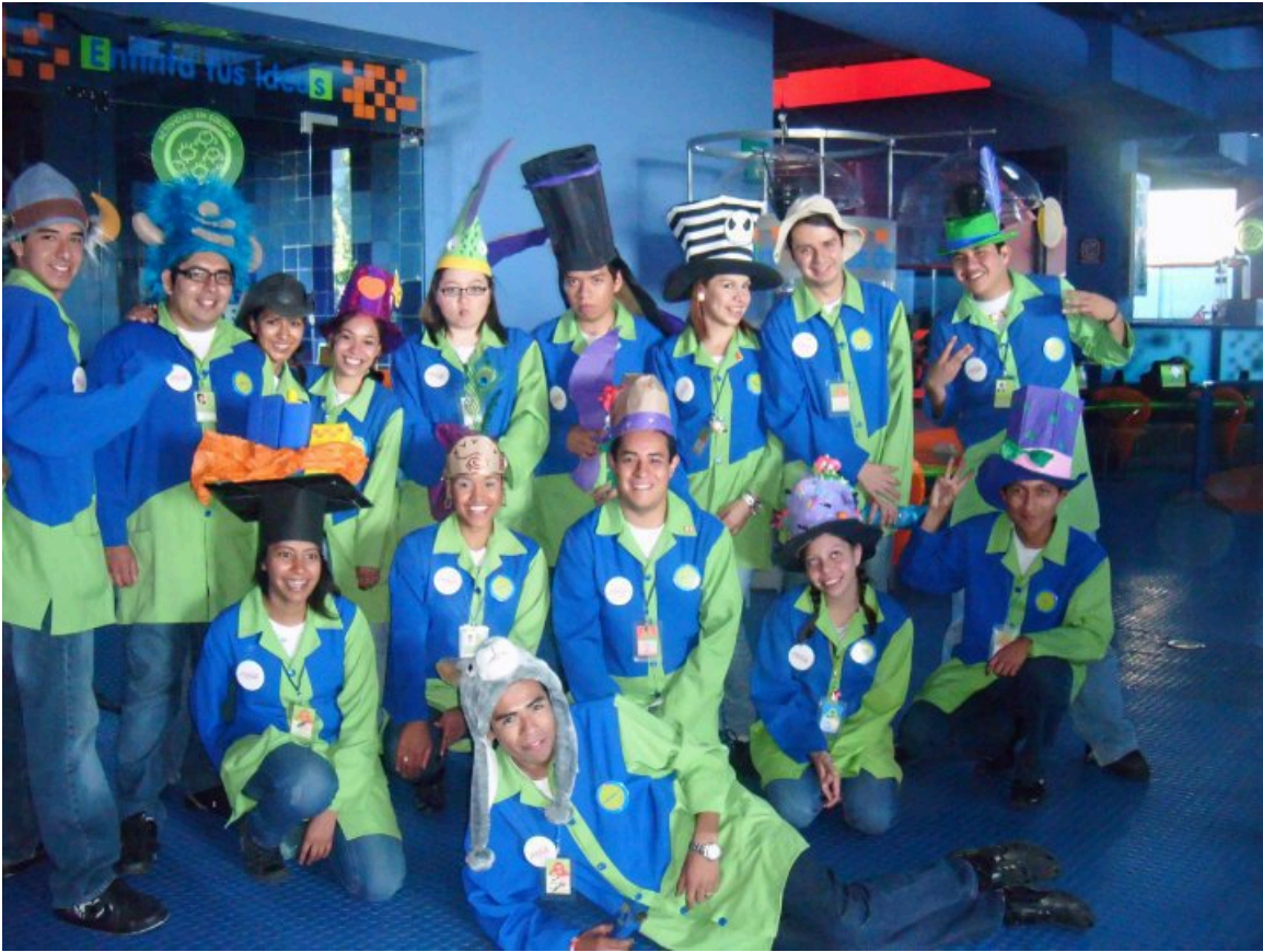
Festival del sombrero, vacaciones de semana santa 2010