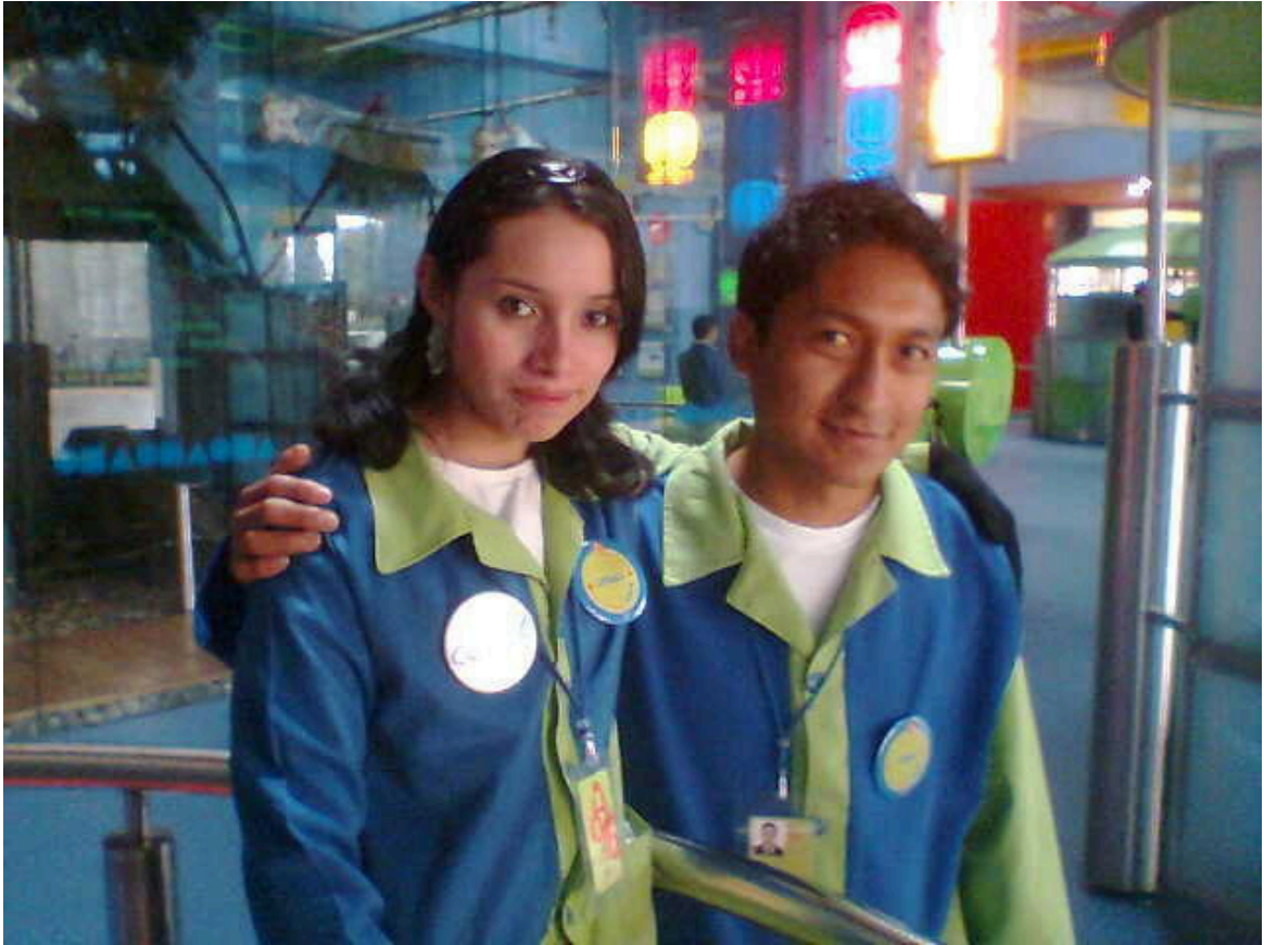
Con buena energía y camaradería recibíamos el día.