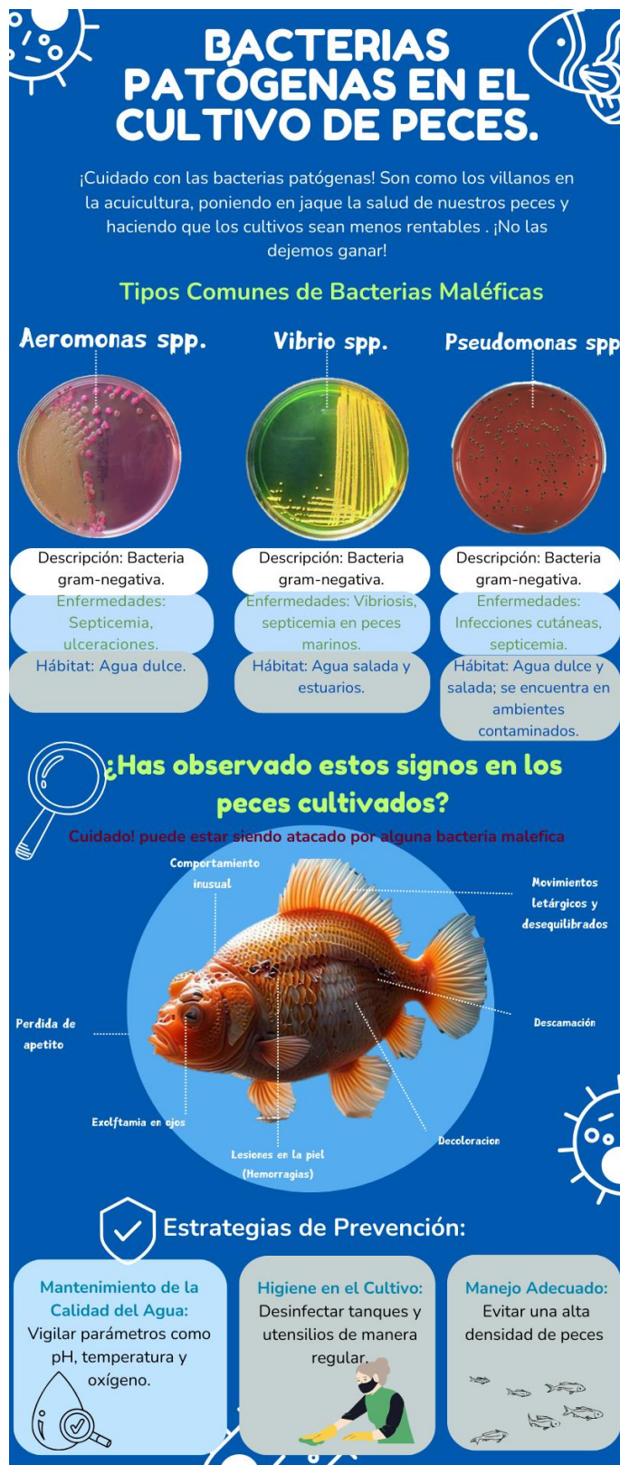
Figura 2. Material de difusión sobre los resultados obtenidos para productores acuícolas y sociedad en general.