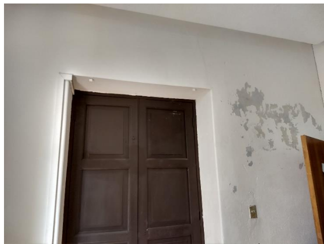
Identificación de problemas de humedad dentro del edificio (Problema generado por mal trabajo de gestión pasada)