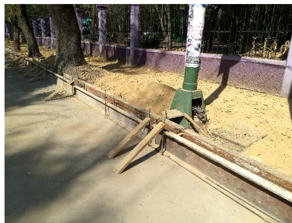
Encofrado de acero usado en el proyecto de banquetas