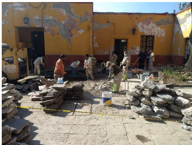
Trabajos en patio central del edificio en Plaza Hidalgo