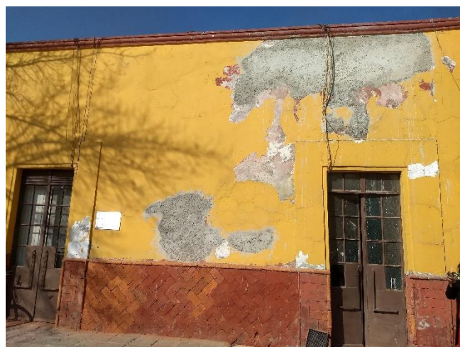
Pintura en mal estado identificada en levantamiento.