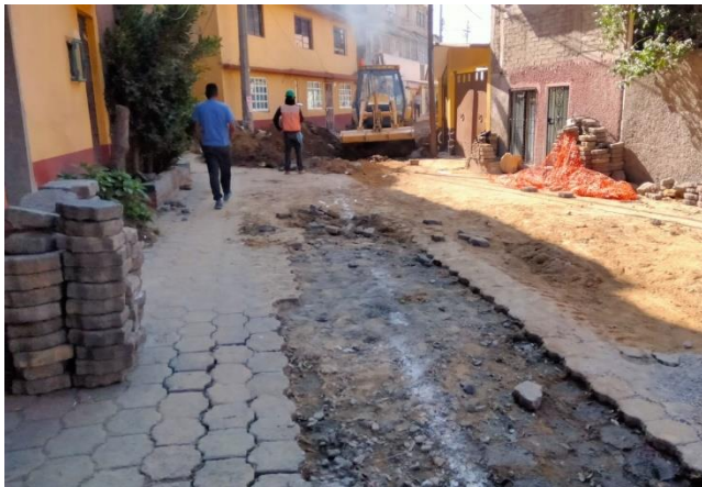
Trabajos realizados de agua potable y drenaje en diferentes secciones de Calle las Flores