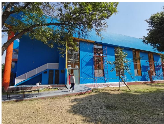
Trabajos de pintura en alberca olímpica