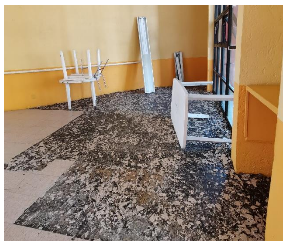
Trabajos inconclusos de gestión pasada en Centro Cultural