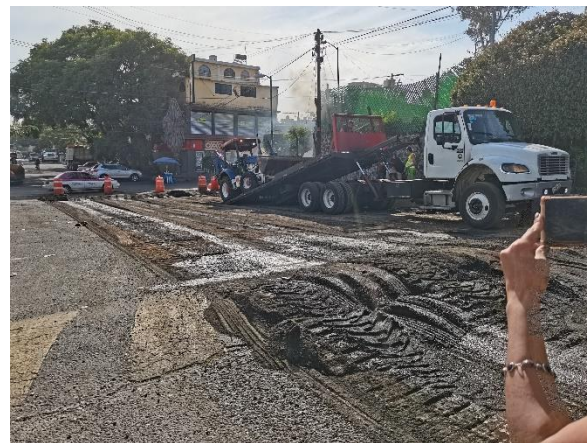
Trabajos de reencarpetado realizados en diferentes secciones de Calle San Benjamín