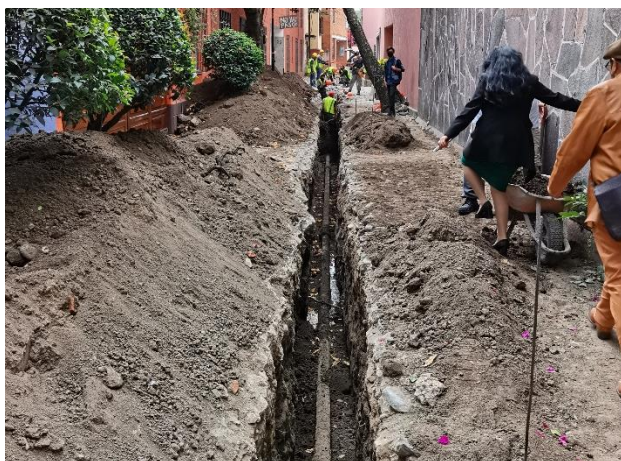
Trabajos realizados de agua potable en Callejón Tlapancalco