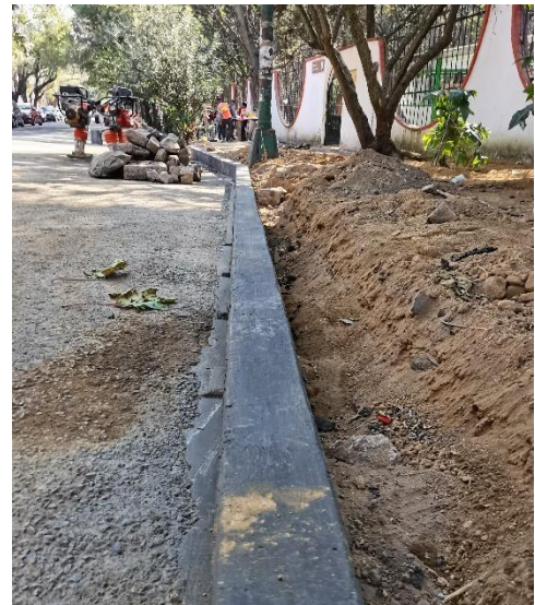
Desenclafado de guarnición en perímetro de los Viveros.