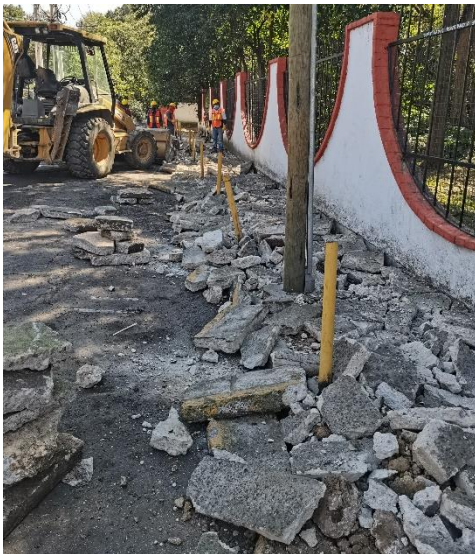
Demolición de banqueta existente para trabajos posteriores.