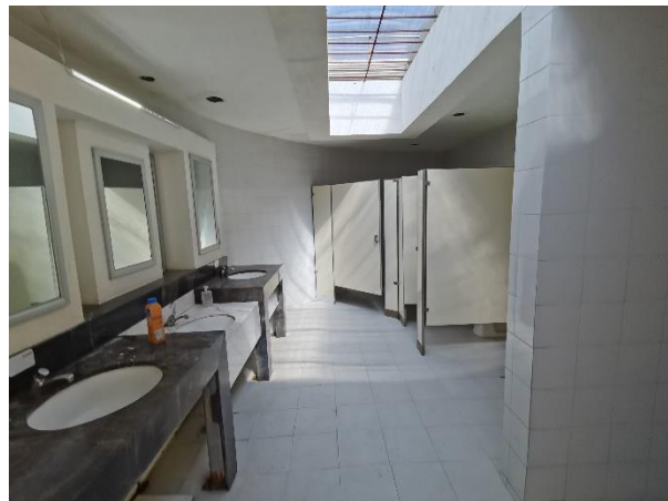
Trabajos de mantenimiento en módulos de baño