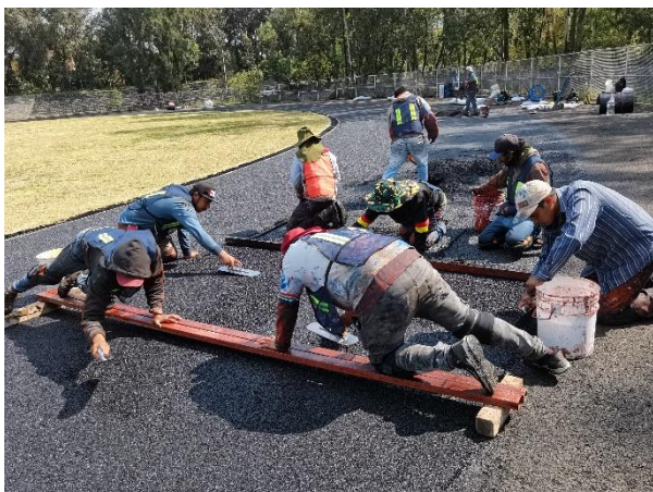
Trabajos en pista de Atletismo