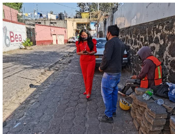
Visita de supervisión en Cerrada Hidalgo