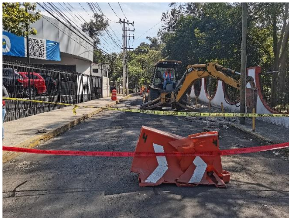
Cierre de vialidades por trabajos de obra