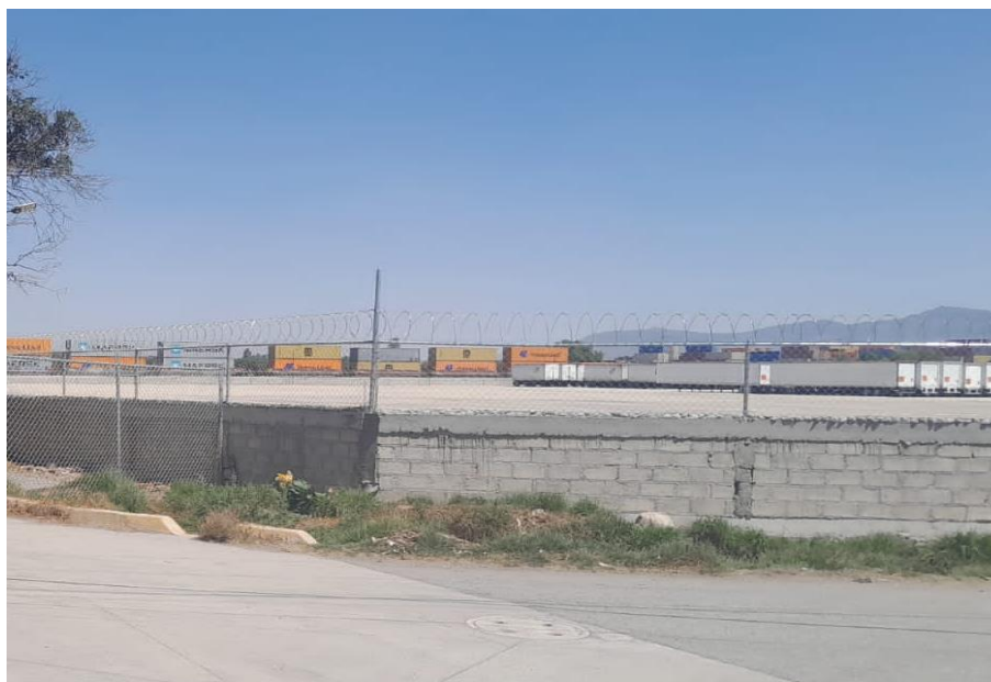
Fotografía tomada con un celular el 14/04/2025.

En conjunto todos los testimonios analizados nos permiten comprender y observar como las transformaciones impulsadas por la urbanización capitalista han generado profundas afectaciones en las distintas dimensiones de la calidad de vida, desde la pérdida de seguridad y bienestar emocional hasta la alteración de las dinámicas comunitarias, esto provoca un escenario de conflicto territorial y degradación ambiental, los modelos de desarrollo basados en la expansión y crecimiento de la industria con poca u casi ninguna regulación reproduce desigualdades y limitan el derecho de una vida digna a los habitantes de la periferia de la Ciudad de México.