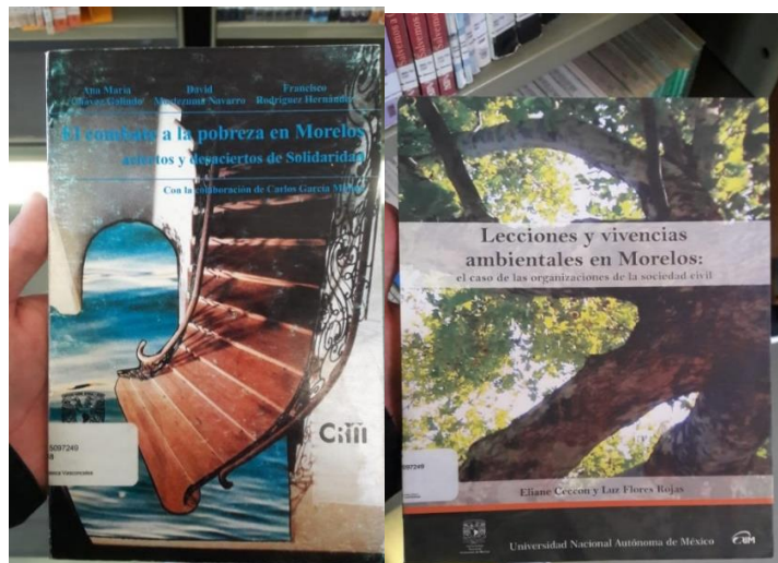
Imagen 1. Libros para el primer acercamiento definiendo la situación socioeconómica del estado de Morelos.