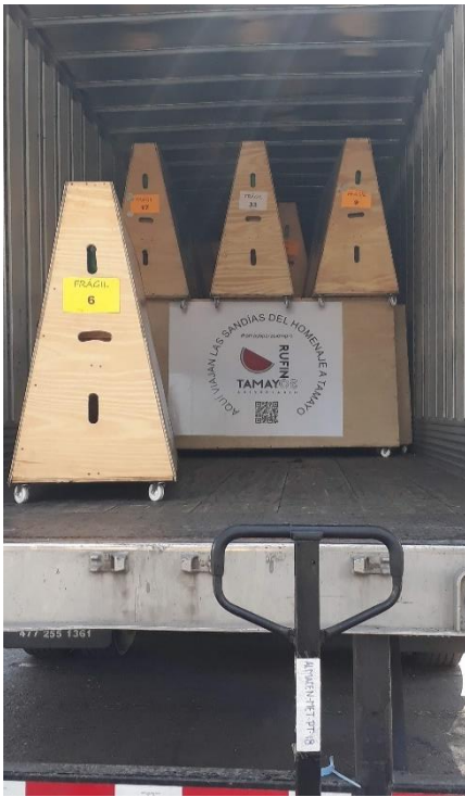
Anexo A. Fotografías transporte de obra.