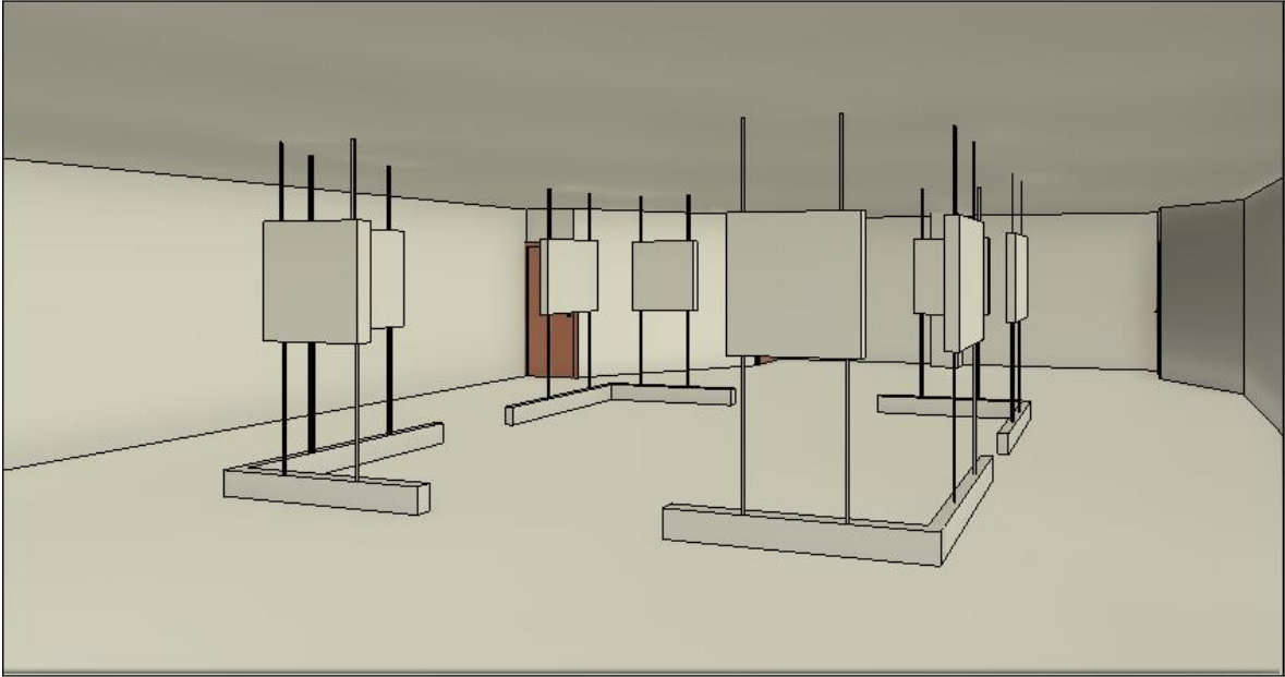
Isométrico arquitectónico. Propuesta de diseño para la Galería del Sur “Leopoldo Méndez”, Autoría propia.