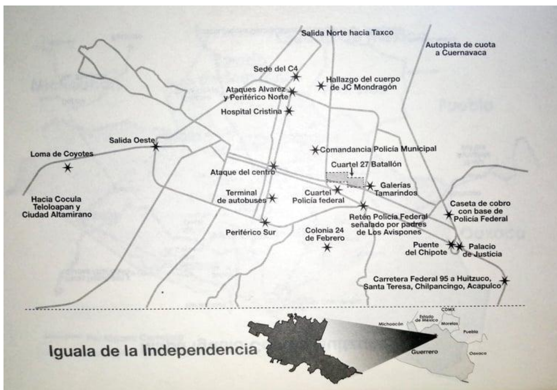
Ilustración 2: Mapa de la zona donde ocurrieron los ataques. Tomada del libro: "Mentira Histórica, Estado de Impunidad, Impunidad de Estado" de Témoris Grecko. 16