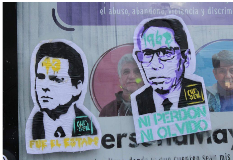
Foto 2. Ex presidentes recordados por los brutales ataques armados de represión contra estudiantes sucedidos durante sus administraciones, Marcha conmemorativa por la matanza estudiantil del 2 de octubre en Tlatelolco. CDMX, 2018.

Al hablar sobre la memoria colectiva no se puede dejar de tratar el olvido, dado que el olvido social se despliega por grupos y tiene elementos constitutivos, entre ellos el silencio, la imposición y la censura, además de ser ejercido que se impulsa principalmente desde el poder (Mendoza, 2005). Tanto la memoria colectiva como el olvido social configuran las sociedades de manera que mientras uno avanza el otro tiende a retroceder, cuando la memoria se incrementa el olvido se minimiza y viceversa.