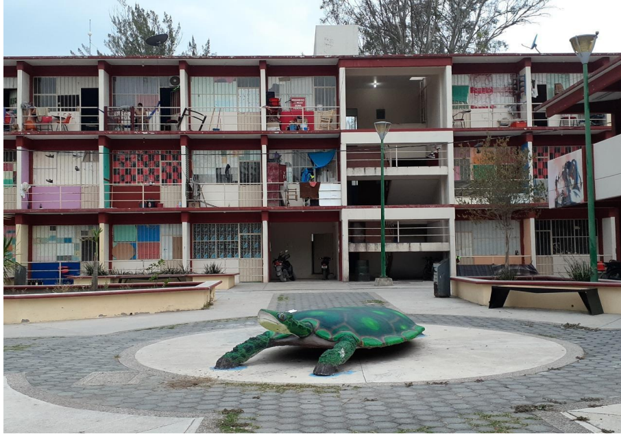
Foto 4: Escuela Normal Rural, "Raúl Isidro Burgos", Fotógrafo: Javier de la Rosa

Civera (2015) también señala que jóvenes entre 12 y 17 años se formaron en escuelas que se ubican en zonas rurales que reclutaban a hijos de ejidatarios o pequeños propietarios, por ello, el proceso educativo se realizaba en los internados con alimentación y limpieza, dando un valor al trabajo, la disciplina, la vocación de servicio y el compromiso social.