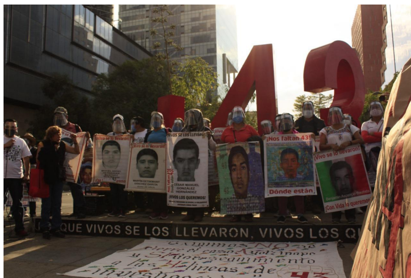
Foto 5: Protesta mensual en antimonumento +43, Ciudad de México 2021.

Durante la actual administración, madres y padres de los 43 han obtenido atención por parte de diversos servidores e incluso del mismo representante del ejecutivo quien ha reafirmado su compromiso, sin embargo, los padres y madres no bajan la guardia ya que consideran que aunque durante esta administración la investigación muestra avance, siguen siendo insuficientes los elementos para la obtención de su propósito, justicia y verdad.