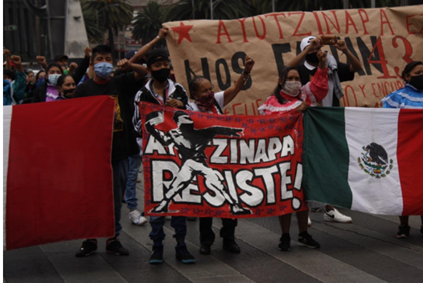
Foto 1: Manifestación por Ayotzinapa cierra el paso de Avenida Reforma por paso de militares, CDMX, 23 de Mayo 2021, Fotógrafa: Natalia Pérez

Vélez (2016), menciona varios tipos de afectación que sufren los familiares de las víctimas, el primero tiene que ver con lo económico; ellos asumen las deudas del desaparecido, responden por sus hijos y financian su búsqueda. Otro tipo de afectación muy lamentable es aquella que desarticula los vínculos amistosos y familiares del desaparecido por miedo a represalias, lo que convierte a la desaparición en un tema tabú e inhabilita una respuesta positiva cercana a las víctimas indirectas (Vélez, 2016). Al respecto cabe mencionar que los padres de los 43 desaparecidos de Ayotzinapa han expresado en diversas ocasiones su desgaste físico y emocional ocasionado por la pérdida de sus hijos y agravado por las estrategias de evasión para la pronta resolución y esclarecimiento del caso por parte de las autoridades.