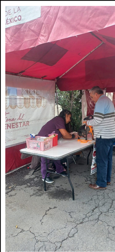
Imagen 4. Aplicación de vacuna antirrábica en Jornada de vacunación.