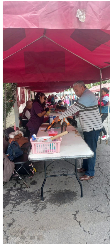
Imagen 5. Solicitando datos de paciente y propietario para entregar comprobante de vacunación.