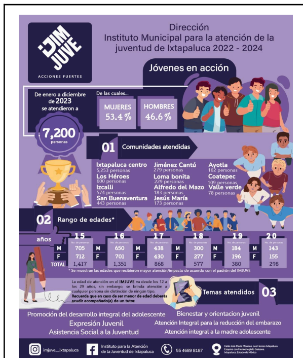
1. Infografía sobre resultados y beneficiados por el IMJUVE en el año 2023