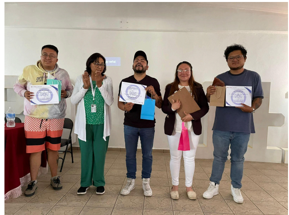
10. Entrega de reconocimientos a expositores y equipo de trabajo de IMJUVE por la ponencia sobre "Inteligencia emocional" llevada a cabo en las instalaciones de la Escuela Preparatoria Oficial 141 del municipio de Ixtapaluca.