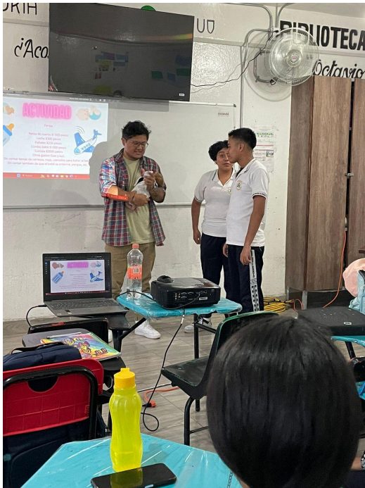
9. Taller sobre prevención del embarazo en telebachillerato "El molino", nivel preparatoria