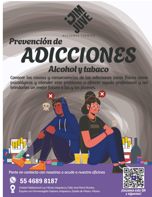
6. Invitación al foro de prevención de adicciones llevada a las escuelas del municipio