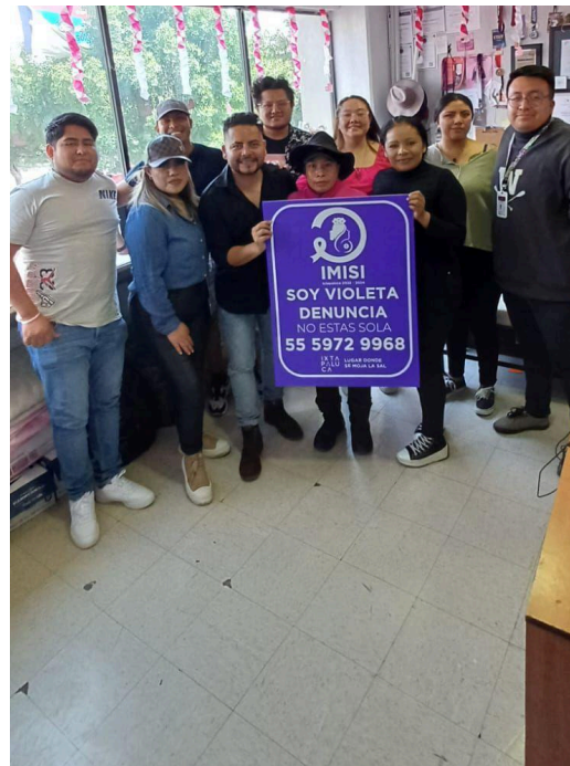
8. IMJUVE presente en la campaña "Soy violeta" alrededor del municipio