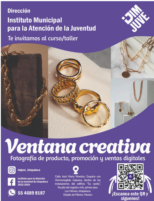
5. Taller que impartí sobre fotografía de producto y ventas digitales