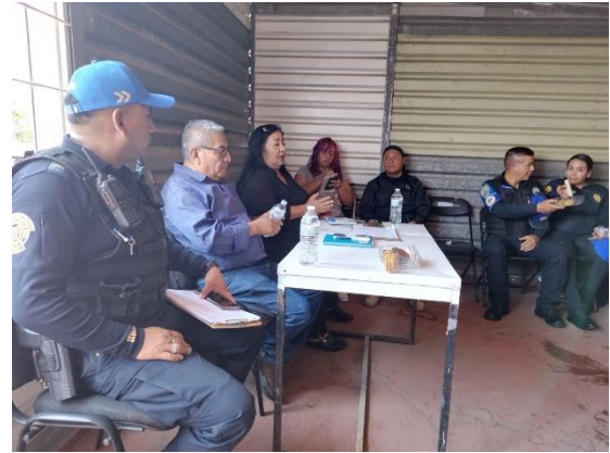
Asistencia a reunión con seguridad pública.