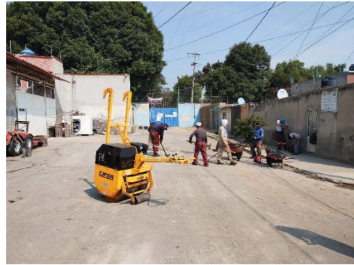
Reparación de asfalto en Col. Santa Martha Acatitla Norte.