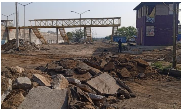
Visita de inicio de obras en la próxima Utopía del niño y la niña en U.H. Ermita Zaragoza.