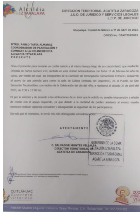
Ejemplo de oficios realizados.