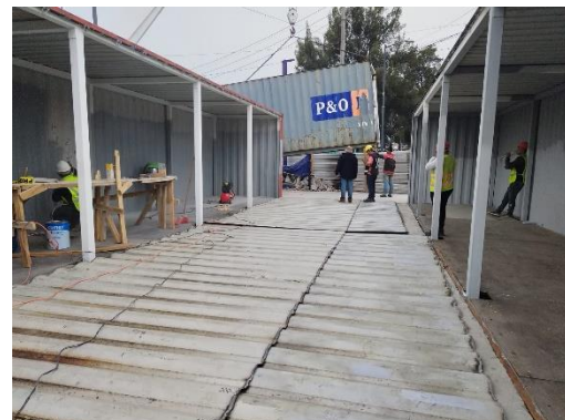
Visita a obra de bici estacionamiento en metro Acatitla.