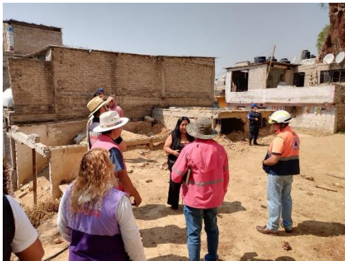
Visita y recorrido col. El paraíso.