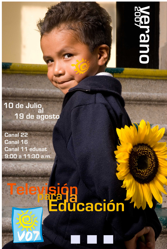
Diseño de cartel genérico para difusión de Verano 2007