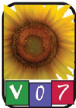
Version -1 Verano 2007