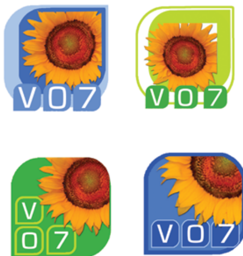
Version -2 Verano 2007