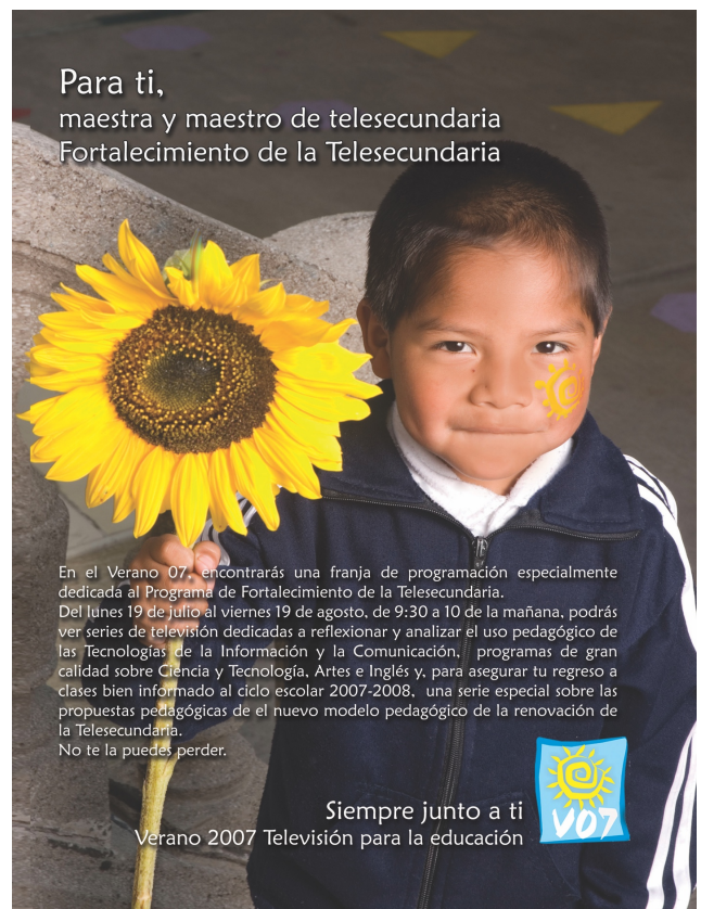
Diseño de cartel para telesecundaria para difusión de Verano 2007