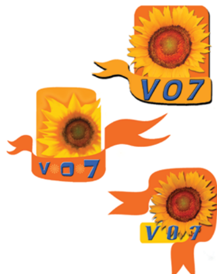
Version -3 Verano 2007