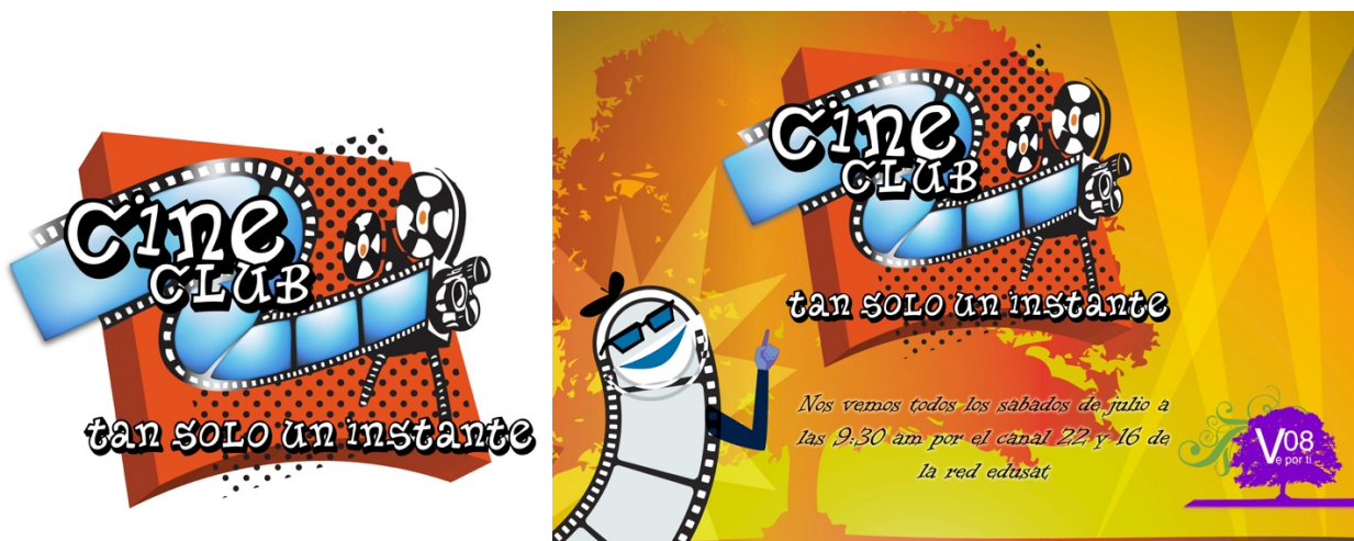
Diseño de anuncio interior Cine Club, Tan solo un instante para no_64 de la Revista Edusat