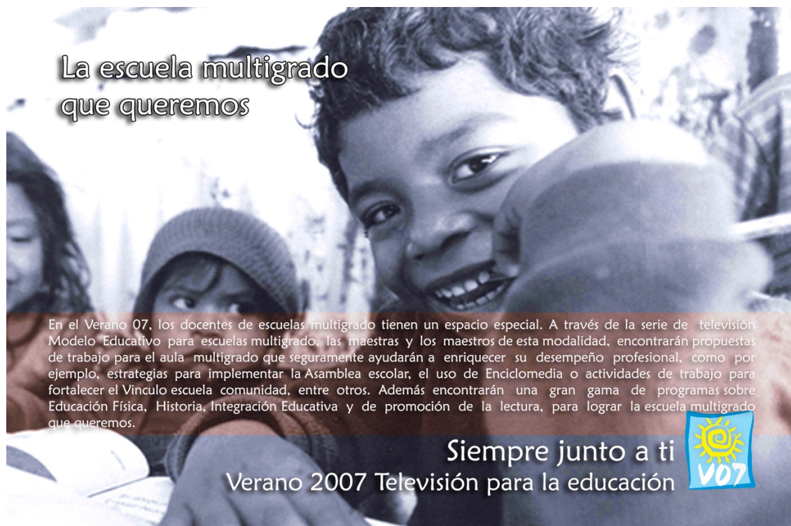
Diseño de anuncio interior La escuela multigrado que queremos para No. 64 de la Revista Edusat.