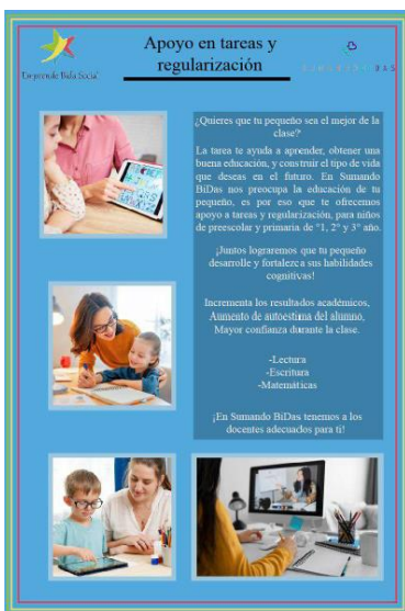
Flyer apoyo en tareas.