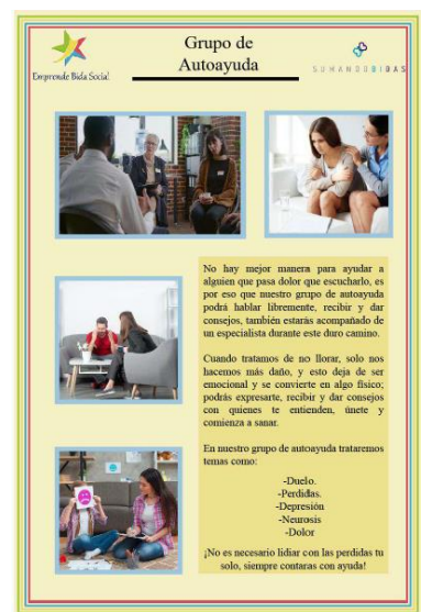
Flyer Grupo autoayuda.