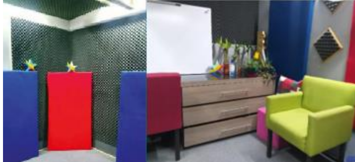
Cabina de radio, antes y después.