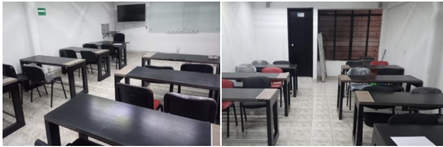
Salón de usos múltiples, antes y después.