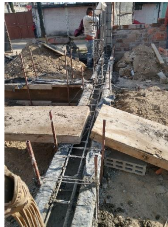
5. Edith Martínez, año 2023, Fotografía de colado de cimentación por medios manuales en zona de depósitos, obra Tlaxilacalli