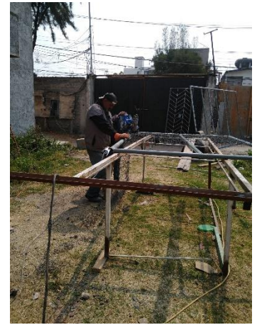
8. Edith Martínez, año 2023, Fotografía de Protección de seguridad para barda perimetral, obra Tlaxilacalli