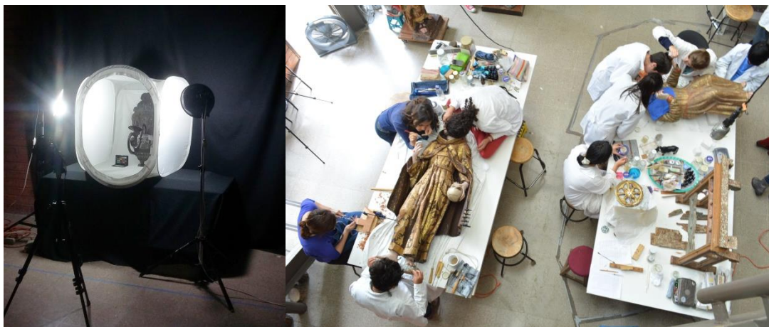
Fotografías de restauración y documentación de piezas.