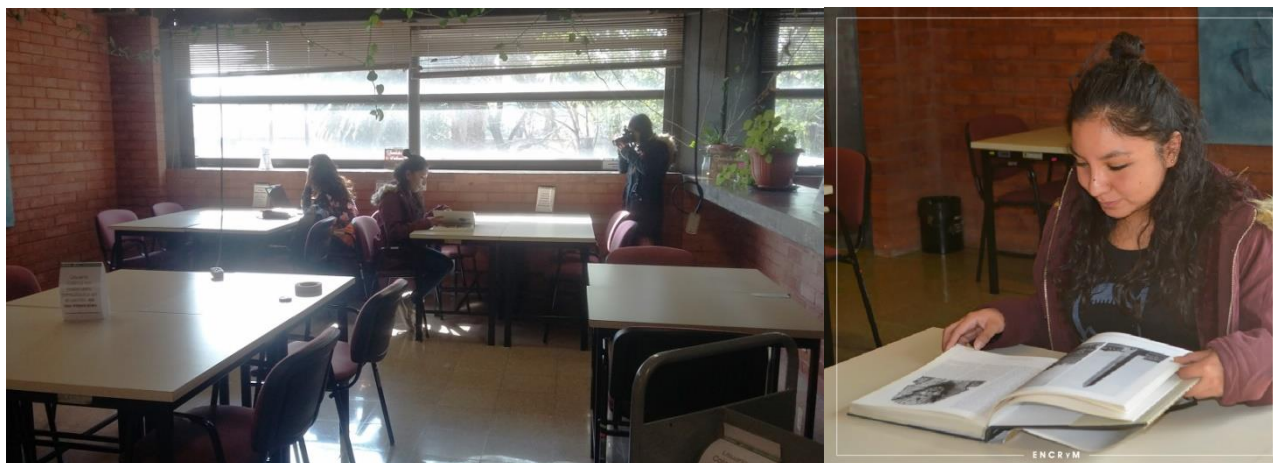
Toma de fotografías para informar servicios bibliotecarios dirigido a estudiantes de la ENCRYM. Izquierda: fotografía detrás de cámaras. Derecha: Fotografía editada.