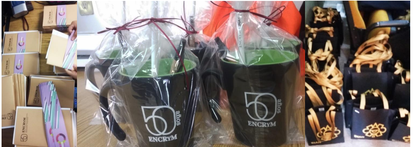
Izquierda a Derecha: Realización de cuadernillos, acomodo de tazas por 50 años de la ENCRYM y bolsas de gabardina.