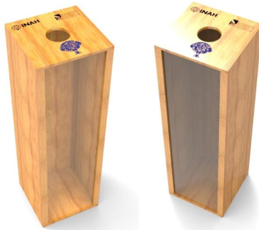
Renders de la propuesta realizada.