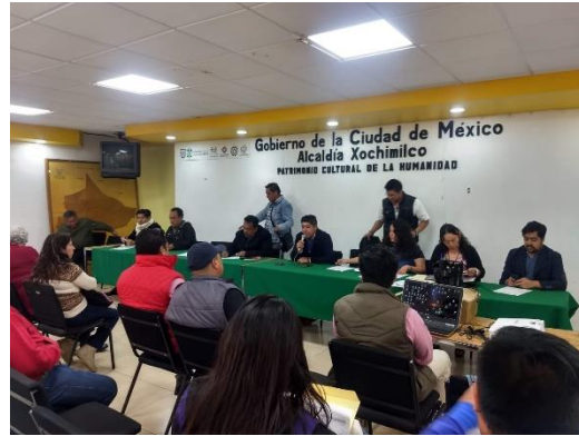
Fotografía 5. Reuniones del presupuesto participativo en la Alcaldía.