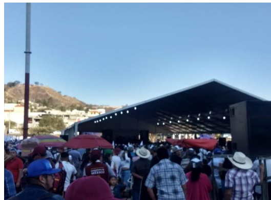
Fotografía 7. Participación social en tareas de la Alcaldía Xochimilco.