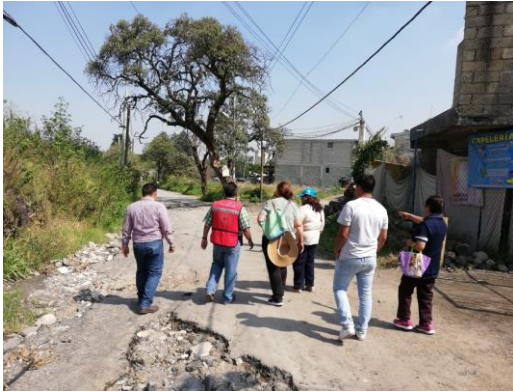
Fotografía 4. Recorrido en zonas estratégicas.