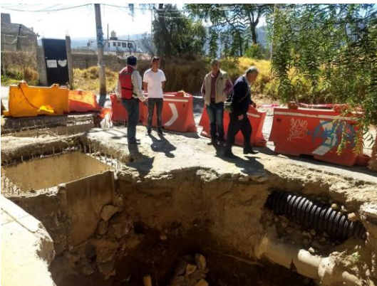
Fotografía 8. Recorrido en zonas afectadas.