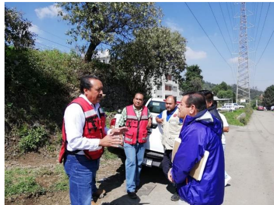
Fotografía 9. Recorridos entre pobladores y autoridades de la Alcaldía.