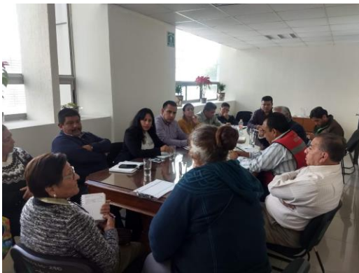
Fotografía 6. Reuniones en las Salas de Conciliación.