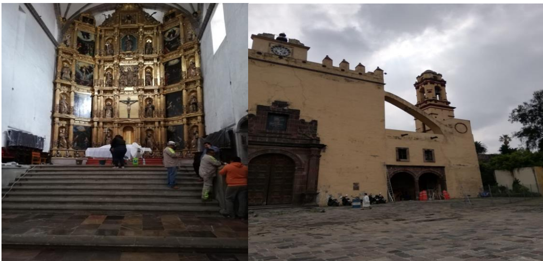
Fotografía 2 y 3. Trabajos de remodelación en la Catedral de Xochimilco.