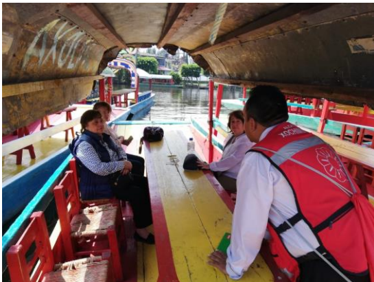
Fotografía 1. Pláticas informativas a los turistas en las trajineras de Xochimilco.