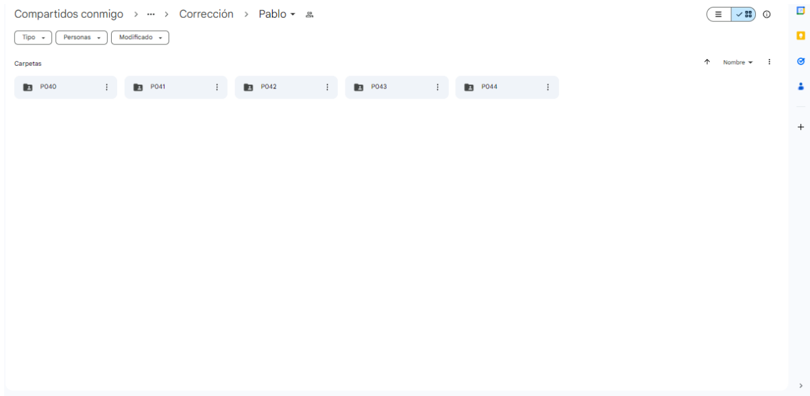
Imagen 4. Los 5 proyectos que me fueron asignados para su revisión y ordenamiento.