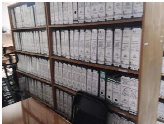
Imagen No 4 y 5 Organización de carpetas de almacenamiento y librerías de acuerdo a contrato y año del mismo,