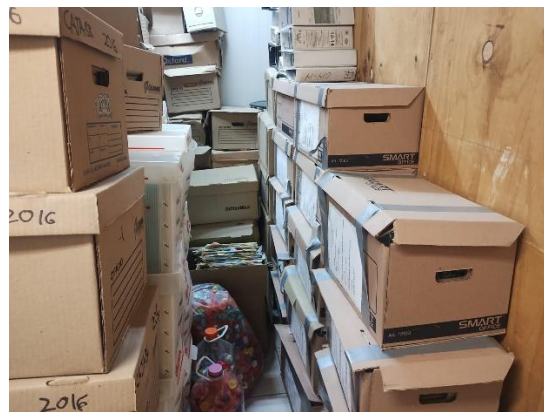
Imagen No 2 y 3 Organización de archivo muerto en almacén para realmacenamiento de zona.