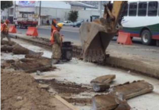
SE REALIZARÓN TRABAJOS DE DEMOLICIONES EN ALGUNAS CALLES DE AV MOCTEZUMA UTILIZANDO MAQUINARIA.