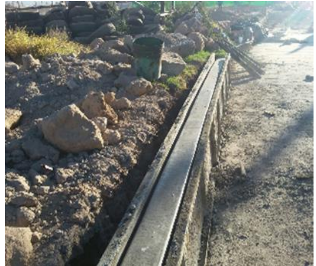
VERIFICACIÓN DEL ALINEAMIENTO DE ACUERDO A CATASTRO Y OBRAS PÚBLICAS PARA LA TRAZA DE LAS BANQUETAS Y LA PAVIMENTACIÓN DE LAS VIALIDADES EN PROLONGACIÓN MATAMOROS.