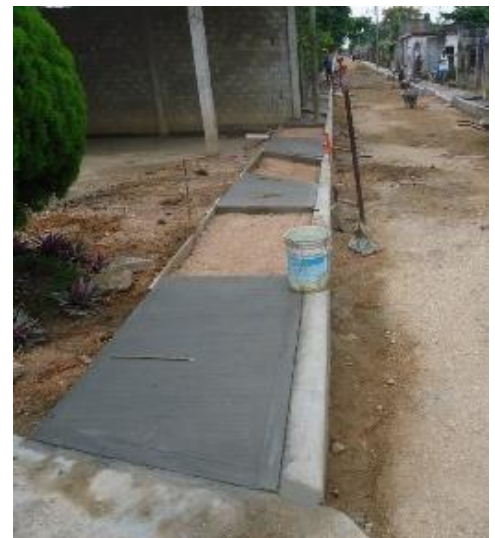
COLADO DE BANQUETAS DE CONCRETO.