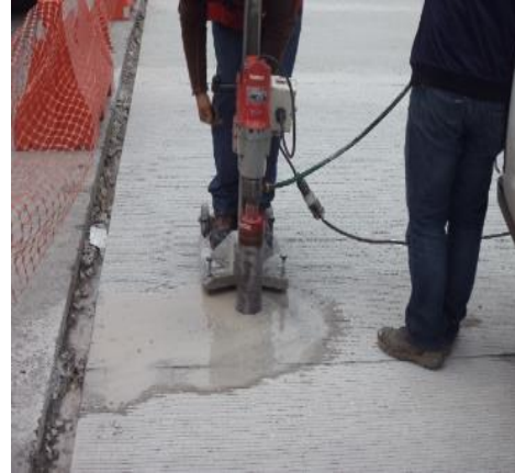
PRUEBAS DE RESISTENCIA DEL CONCRETO.