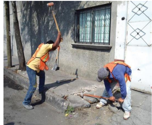
SE REALIZARÓN TRABAJOS DE DEMOLICIONES MANO.