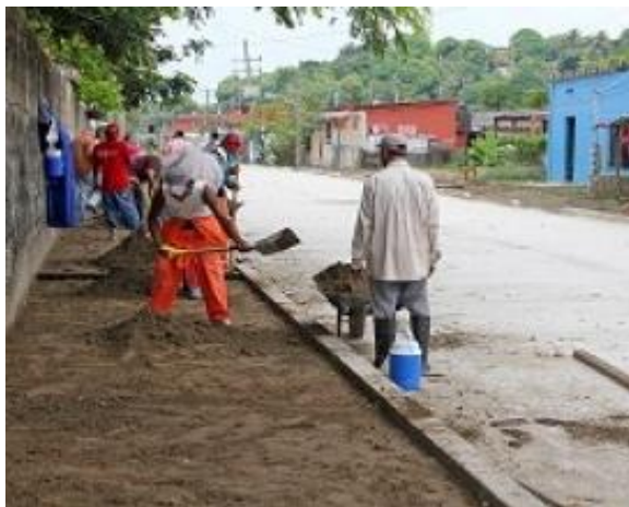
RELLENO Y COMPACTACION CON TIERRA NATURAL. PARA RECIBIR LA BANQUETA.