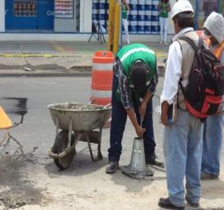
PRUBAS DE REVENDIMIENTO DEL CONCRETO.