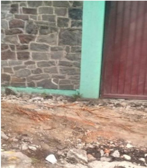
SE REALIZARÓN TRABAJOS DE DEMOLICIONES EN ALGUNAS CALLES DE AV MOCTEZUMA.