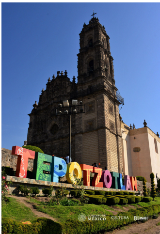
El Templo de San Francisco Javier forma parte del Camino Real en Tepetzotlán. 2021.

Se nos otorgó un manual como punto de partida para el rediseño de la señalética, nos sirvió como guía para las dimensiones, gama de colores, tipografía, entre otras características con las que debía contar nuestro diseño. De esta manera comenzamos el proceso de diseño con una lluvia de ideas y bocetaje.