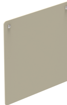
Modelo 6. g) Señal orientativa / restrictiva colgante (2021) Lámina de aluminio cal.10 Tornillos allen cabeza de botón