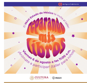
Cartel elaborado para uno de los talleres para niñas y niños impartidos por el INAH. 2021