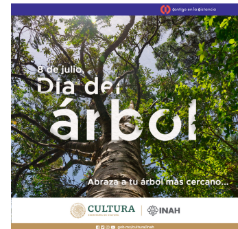
Imagen realizada para las efemérides mensuales publicadas en redes sociales. 2021

Una vez concluido este proyecto, la encargada del servicio social por parte de la institución nos asignó proyectos más acorde con el Diseño Industrial.