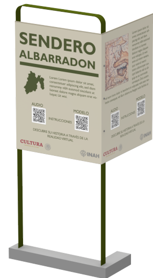
Cédula Patrimonial y de Recomendaciones realizada para el proyecto Sendero el Albarradón . 2022

Finalmente se entregó el proyecto a los encargados del servicio para su revisión y aprobación. Con este proyecto concluí mis actividades correspondientes al servicio social.