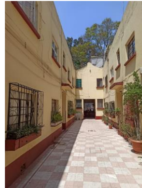
2. Pintura en fachada. Imagen propia.