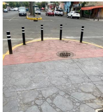
6. Mejoramiento urbano. Imagen propia.