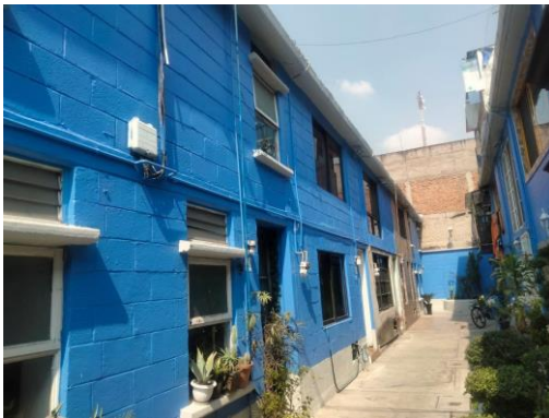
3. Pintura en fachada.