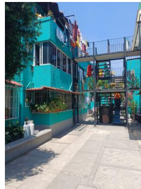
4. Pintura en fachada.