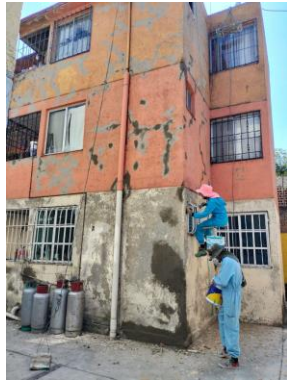
1. Resanado de fachadas. Imagen propia.