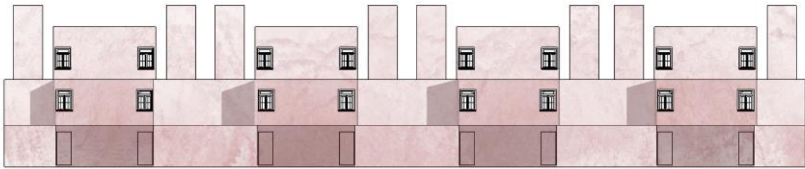
Imagen 3. Modelo, proyecto Palo Alto.