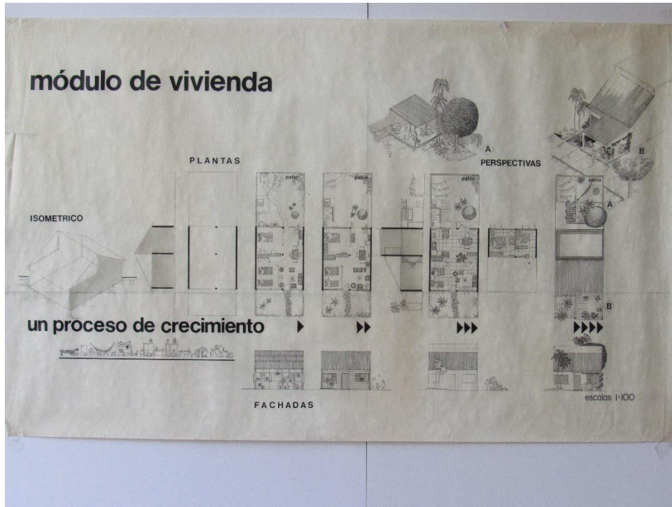
Imagen 4. Fotografía a proyecto Salina Cruz