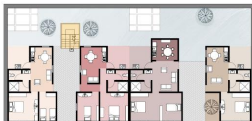
Tercer Etapa Planta Baja