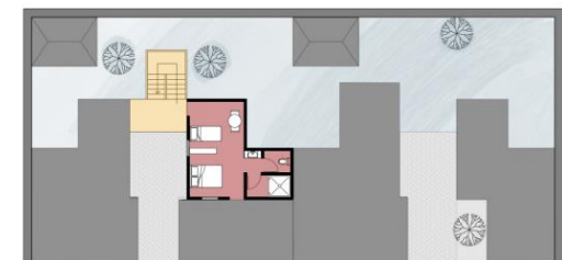
Tercer Etapa Planta Alta