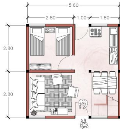
Imagen 2. Plantas arquitectonicas, proyecto San Luis Tlaxiátemalco