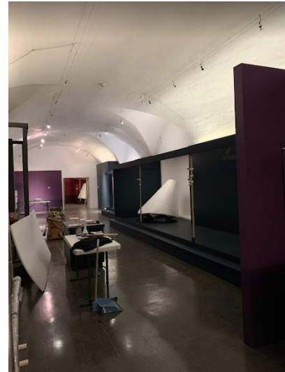
Imagen 7 y 8 Inalación de Muestra temporal – Miguel Gregorio Molero. Un tejedor de ultramar.