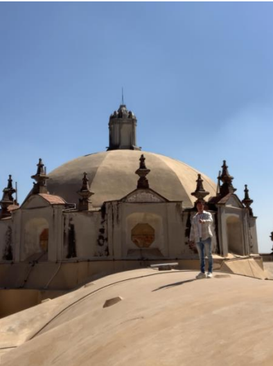
Recorrido y levantamiento del Templo de San Francisco Javier