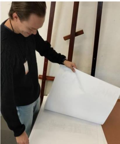
Imagen 6 Revisión de planos del levantamiento del Templo de San Francisco Javier