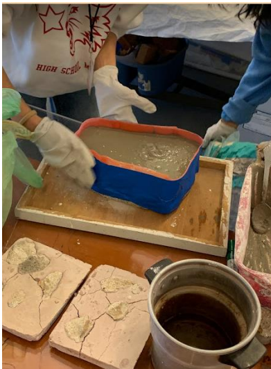
Imagen 2 Prueba de Mortero