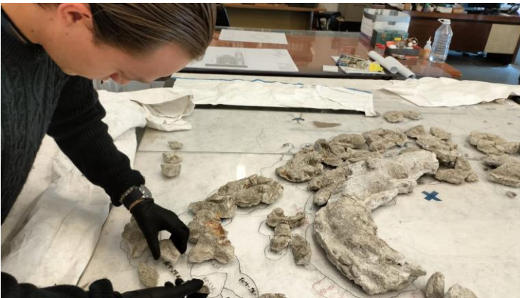
Imagen 3 Revision y acomodo de los fragmentos del marco.