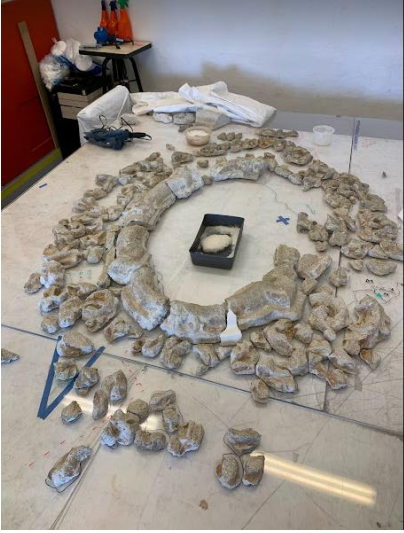
Imagen 1 Situacion actual del marco "Moldura del Imafrente"