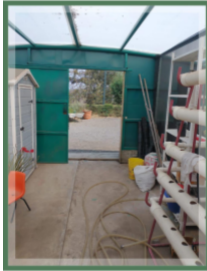
Nota. Lugar para tapete. .[Fotografía ]Personal.2025.