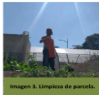
Imagen 3. Limpieza de parcela.