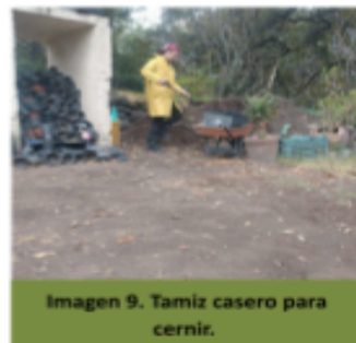
Imagen 9. Tamiz casero para cernir.