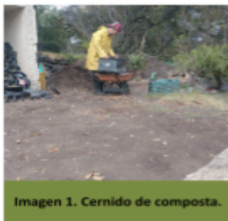
Imagen 1. Cernido de composta.