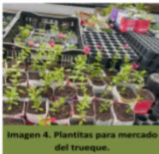
Imagen 4. Plantitas para mercado del trueque.