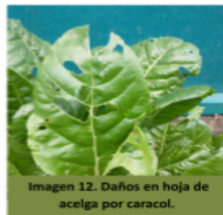
Imagen 12. Daños en hoja de acelga por caracol.