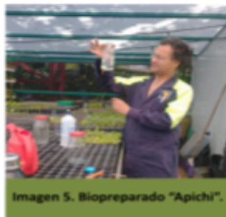
Imagen 5. Biopreparado "Apichi".