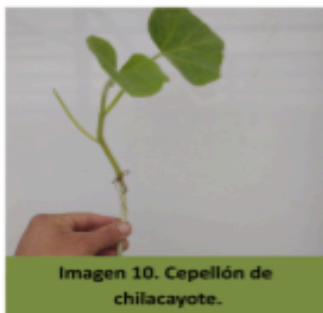
Imagen 10. Cepellón de chilacayote.