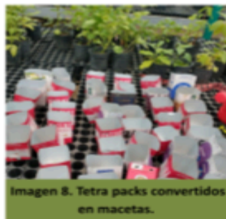
Imagen 8. Tetra packs convertidos en macetas.