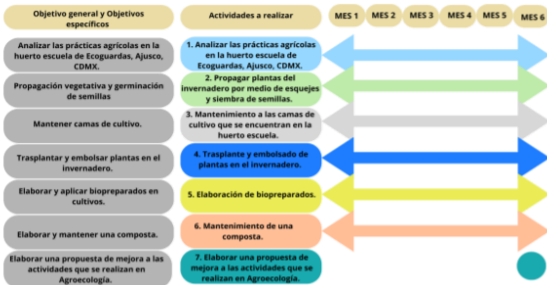
Diagrama basado en el calendario de actividades.

Nota. Actividades mes a mes. [Diagrama basado en hoja de excel]. Universidad Autónoma Metropolitana. 2024. http://cbs1.xoc.uam.mx/ss_cbs/8.php