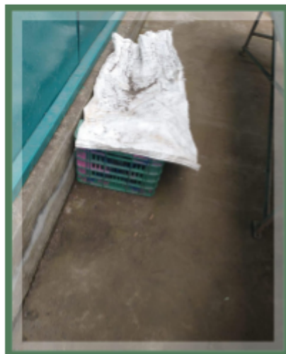
Figura 19. Estado del lombricompostero.

Nota. Lombricompostero. .[Fotografía ]Personal.2025.