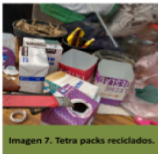
Imagen 7. Tetra packs reciclados.