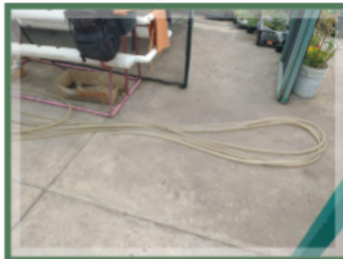
Nota. Manguera de riego. .[Fotografía ]Personal.2025.