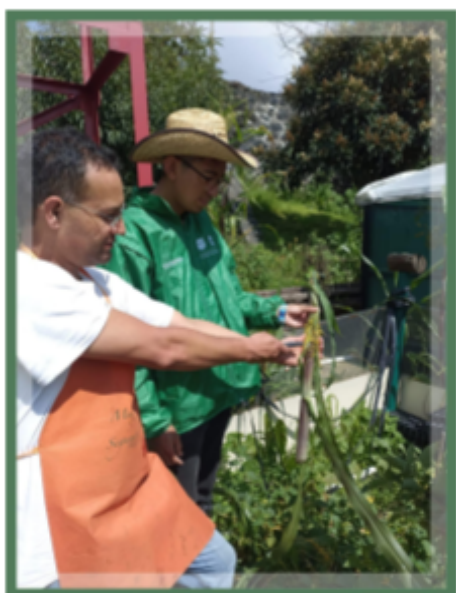
Nota. Detección de cuscuta. [Fotografía].Personal. 2024.