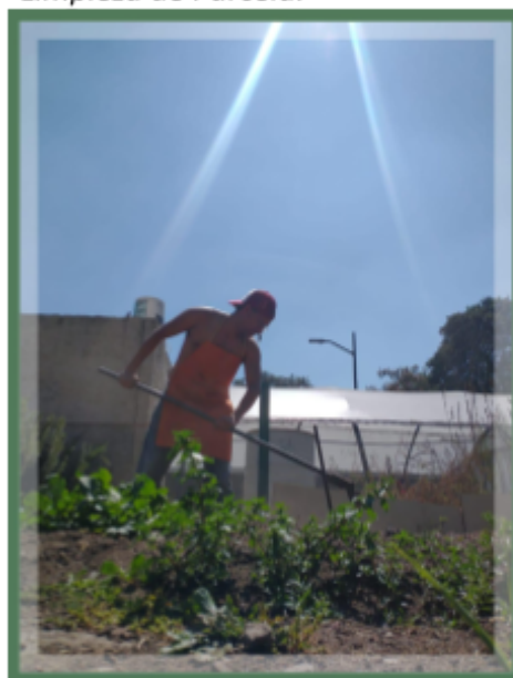
Nota. Labores en parcela [Fotografía ].Personal.2025.