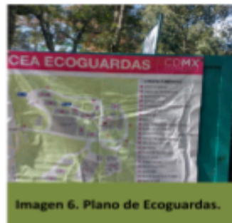
Imagen 6. Plano de Ecoguardas.