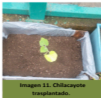
Imagen 11. Chilacayote trasplantado.