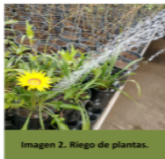
Imagen 2. Riego de plantas.