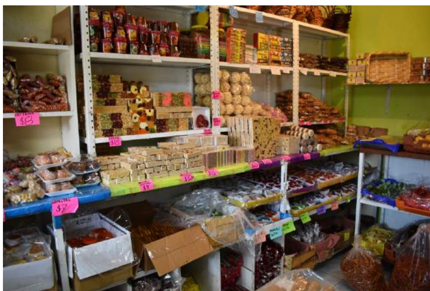
Anexo 7 Registro Fotográfico del dulce cristalizado en Santa Cruz Acalpixca. Registro realizado con Jocelyn Jiménez Santana.