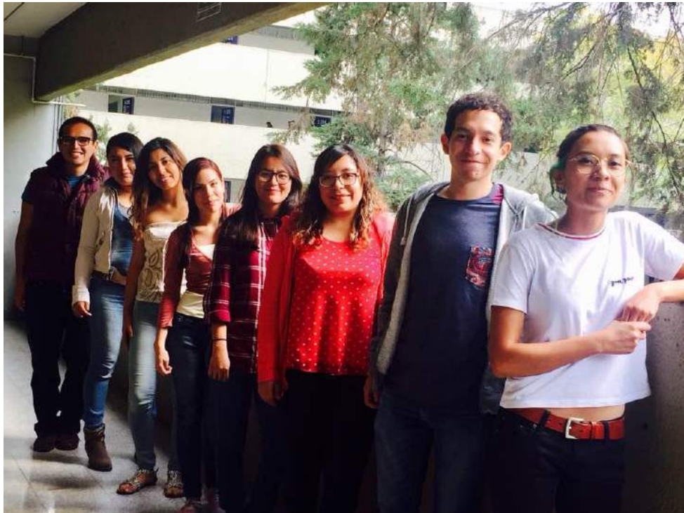
Anexo 8 Equipo de Servicio Social del CIDEX.