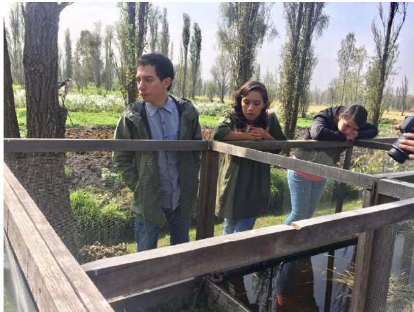
Anexo 3 Diciembre de 2016 Visita a Zona Chinampera. Embarcadero de Cuemanco.