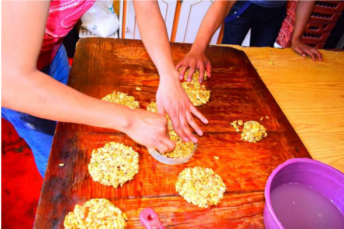
Anexo 7 Registro Fotográfico del dulce cristalizado en Santa Cruz Acalpíxca. Registro realizado con Jocelyn Jiménez Santana