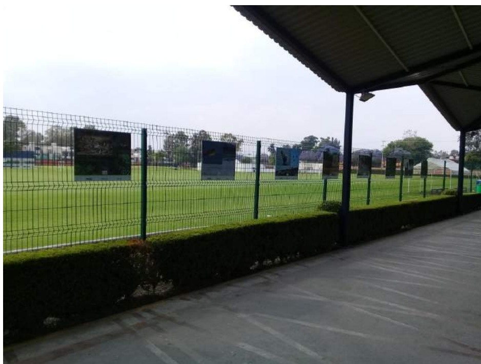
Anexo 6 Exposición de “Por la Custodia de la Biodiversidad” en la zona deportiva.