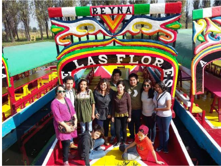
Anexo 3 Diciembre de 2016 Visita a Zona Chinampera. Embarcadero de Cuemanco.