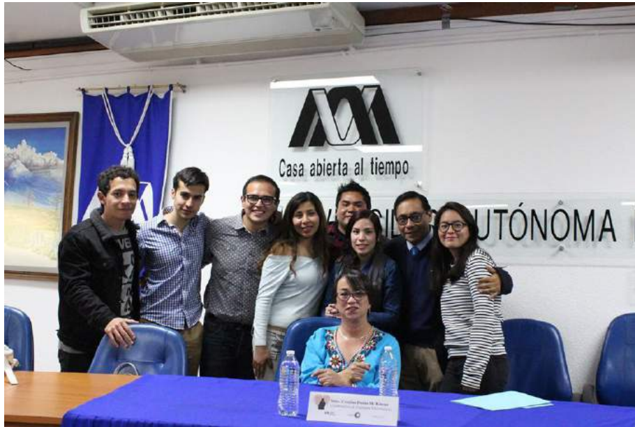
Anexo 4 Febrero 2017 Conferencia La Neurobiología del Amor. Febrero 2017