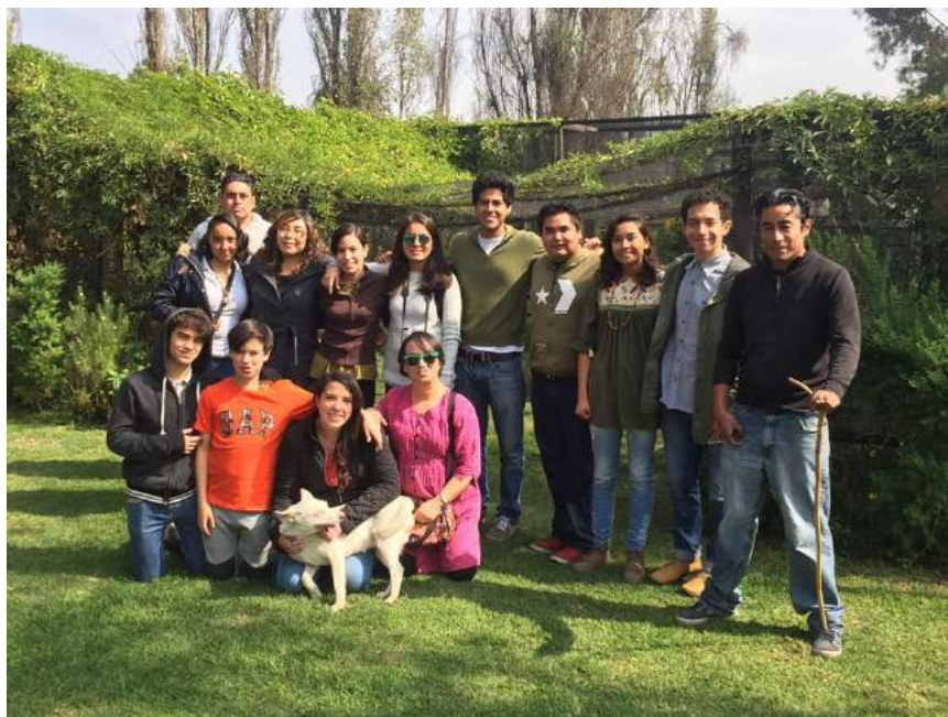
Anexo 3 Diciembre de 2016 Visita a Zona Chinampera. Embarcadero de Cuemanco.