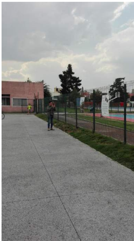
Anexo 6 Exposición de “Insectos Comestibles” en la zona deportiva.