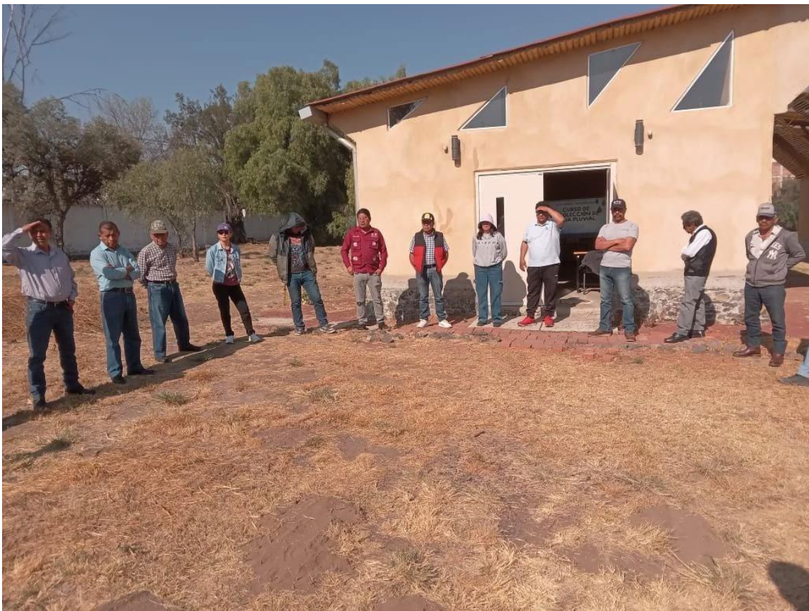
Imagen 1. Presentación de todos los productores asistentes al encuentro.