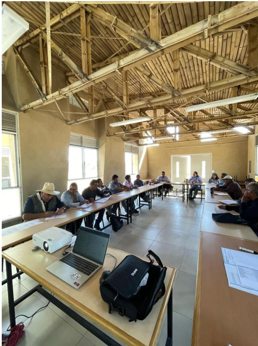
Imagen 8. Participantes realizando por equipos ejercicios de cálculos de fertilización del taller