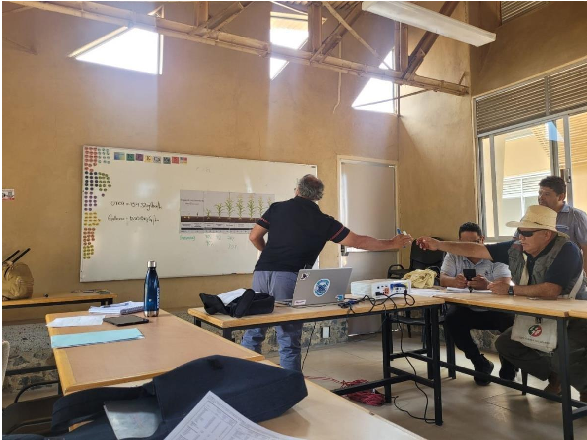
Imagen 9. Se comentaron los resultados obtenidos de cada equipo y los procedimientos que utilizaron.