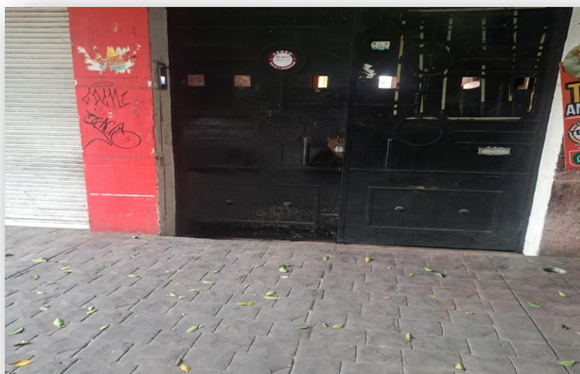
Fachada de Veredas Themis