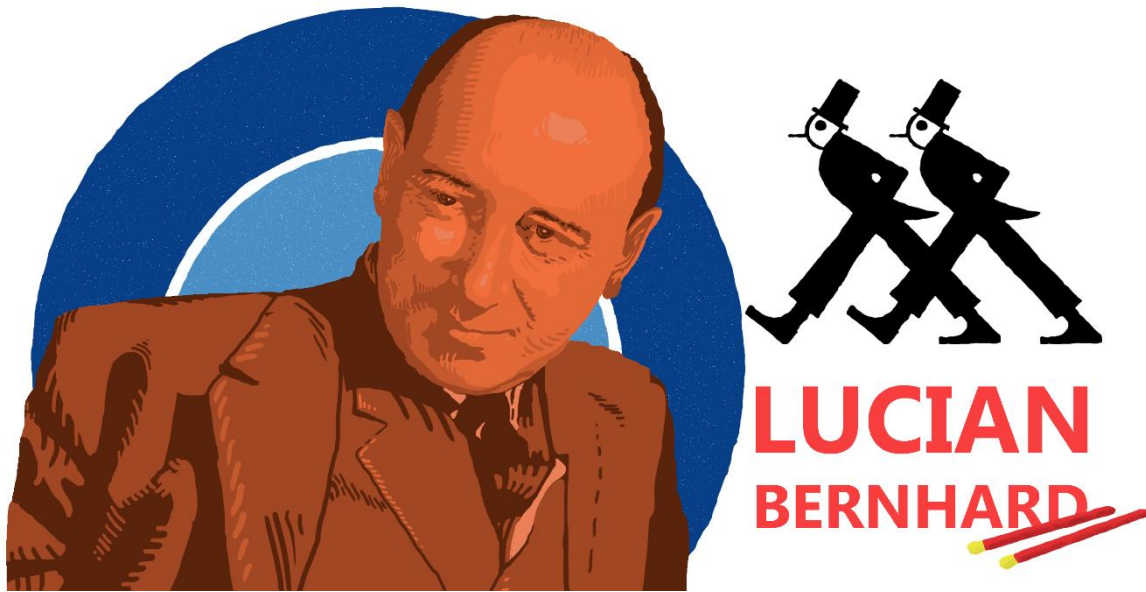
Imagen 3.-Doodle conmemorativo | Lucian Bernhard