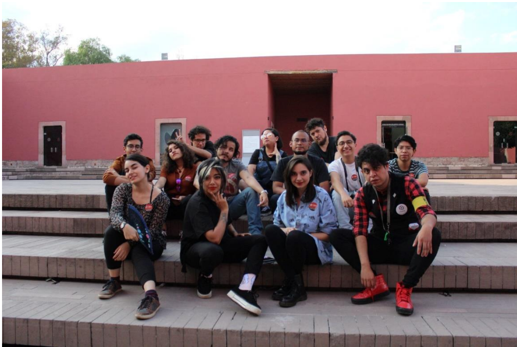
Imagen 6.- El equipo de la Bienal reunido en el Centro de las Artes de San Luis Potosí