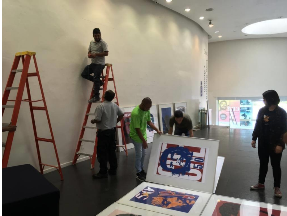
Imagen 5.- Montaje de la exposición "Carteles en homenaje al Che Guevara"