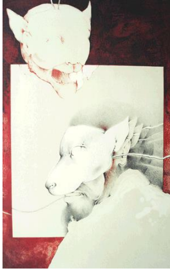
Animales de la noche insomne

Espacio Babel. Edificio central de la unidad UAM-X