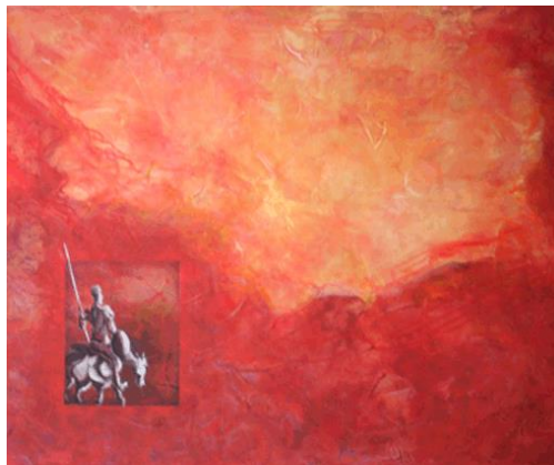
"Argamasilla de alba"