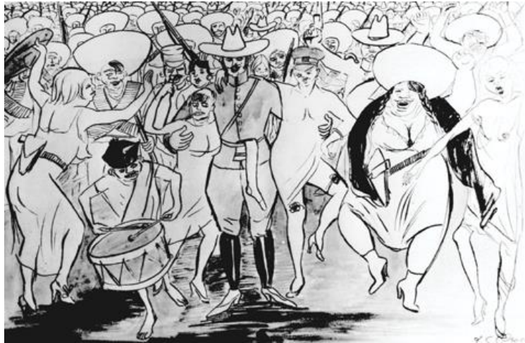
La cucaracha, 1928

9 de Noviembre al 7 de Diciembre de 2007