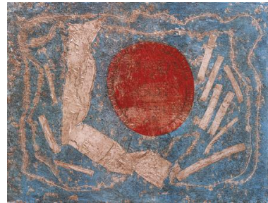
El sol litografía, 1979

Sala "Leopoldo Méndez" Edificio central de la unidad UAM-X