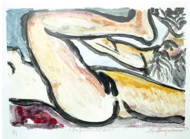
La puerta del deseo

7 de Septiembre al 26 de Octubre de 2007