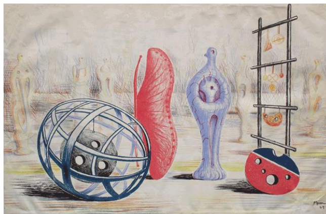
Boceto para proyecto de parque escultórico