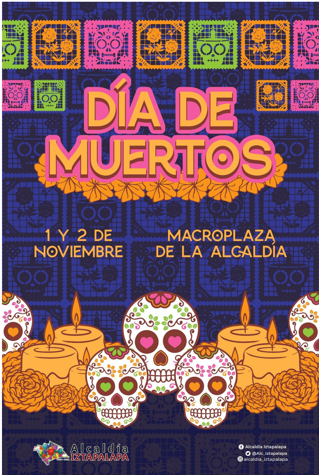
Propuesta de cartel de evento de Día de Muertos