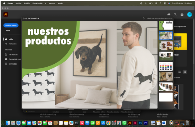
DISEÑO DE CATÁLOGO DE PRODUCTOS DE IMRESIÓN DE LA BICM