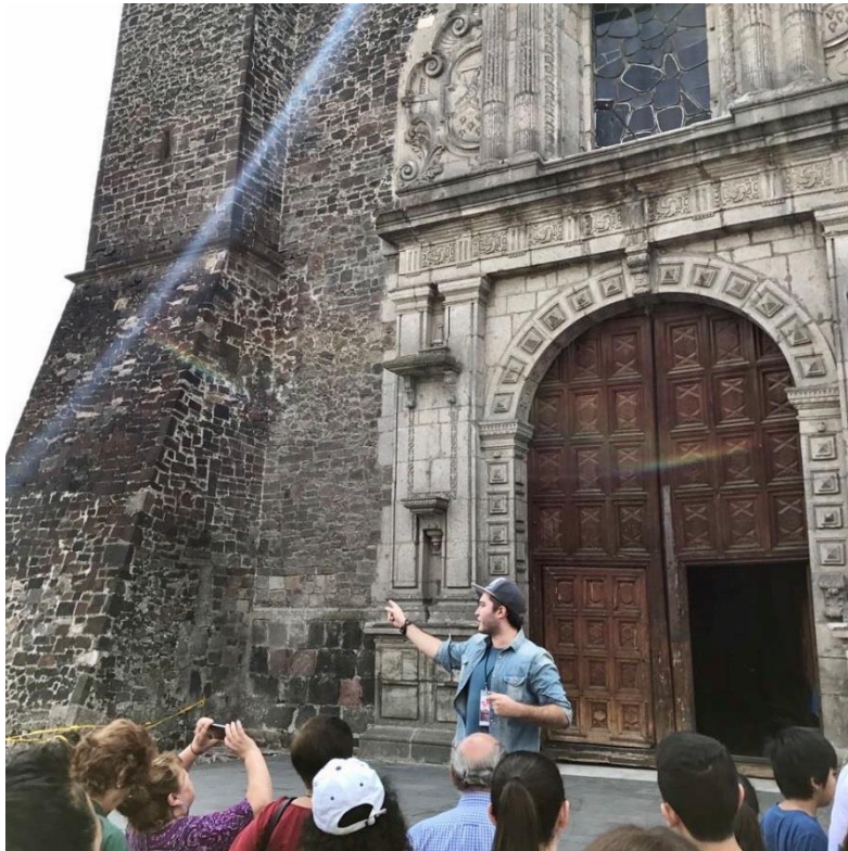
Visita guiada a la plaza de las tres culturas en la iglesia de Santiago Tlatelolco