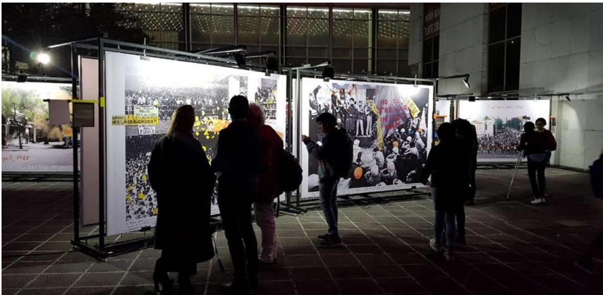
Exposicion terminada de montar