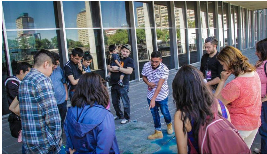
Durante visita guiada por Tlatelolco “Recorrido por el Barrio”