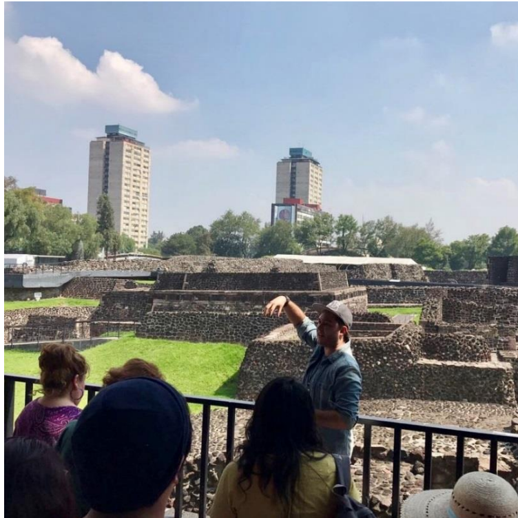
Durante visita guiada a las ruinas de Tlatelolco