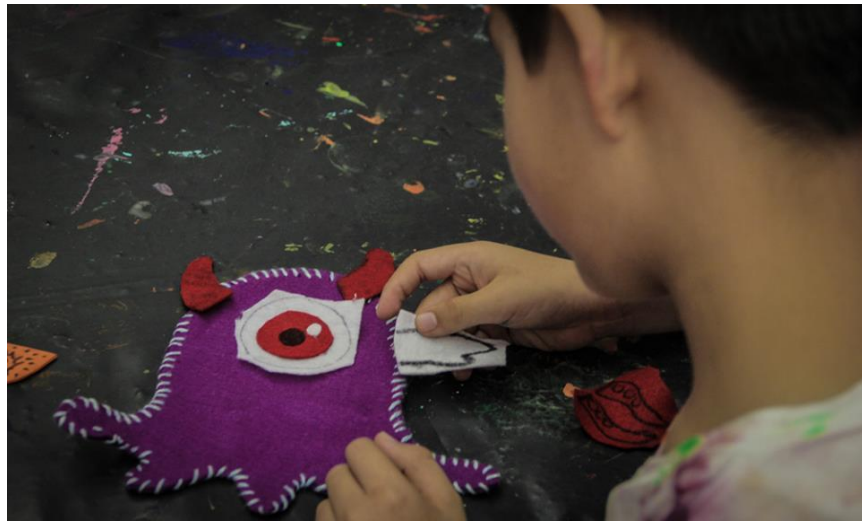
Niño decorando su monstruo en la actividad “Enfrentando nuestros monstruos”