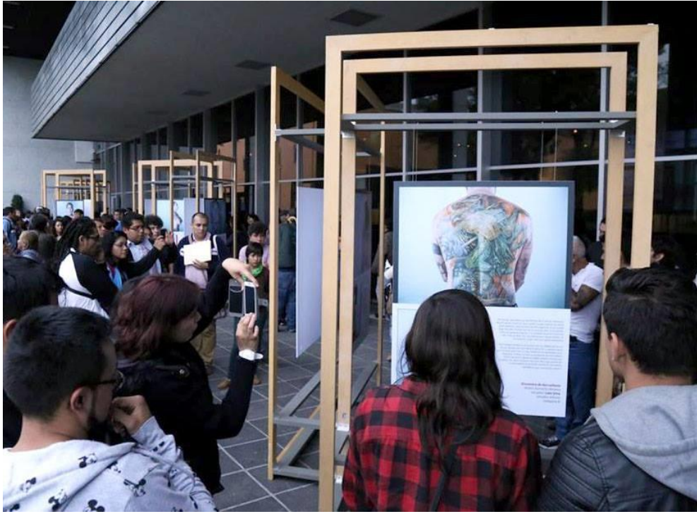
Exposición temporal montada "Tatuajes Prehispánicos"