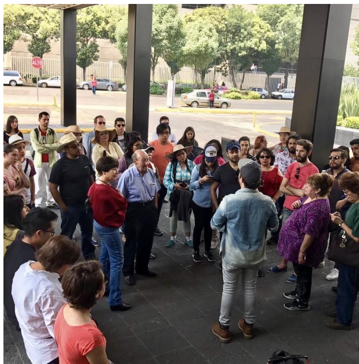
Visita guiada al Memorial del 68