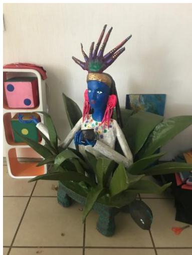
Representación plástica de la diosa mexica del pulque Mayahuel fabricada en cartonería.