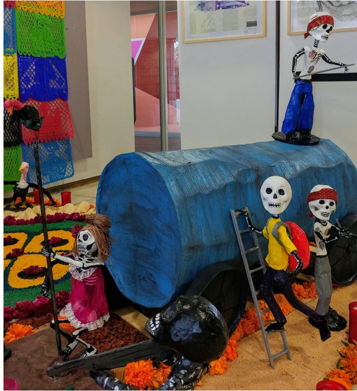
Ofrenda dedicada a los migrantes