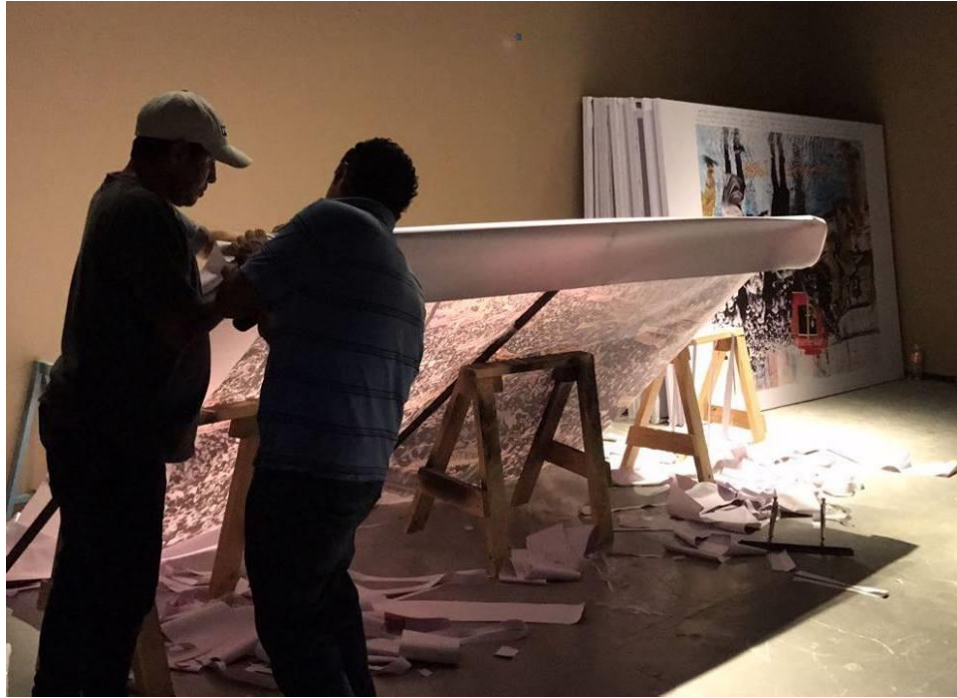
Proceso de montaje para la exposición