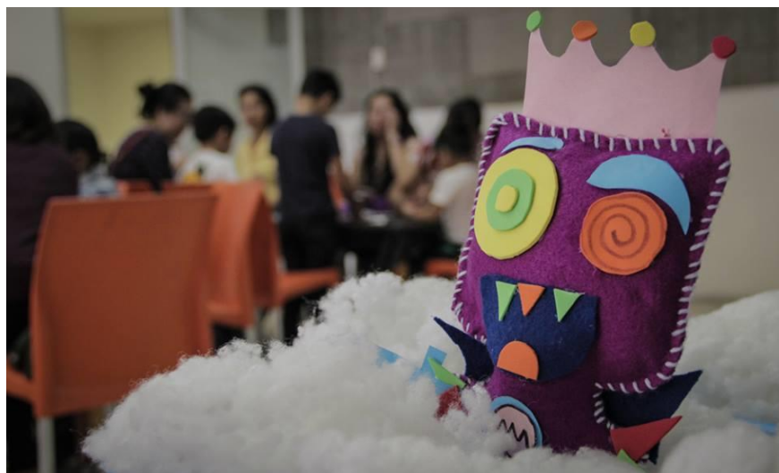
Monstruo realizado para ser muestra de la actividad a realizar