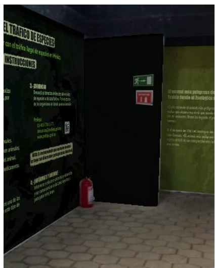
Ejemplos de diseños para gran formato y montaje.