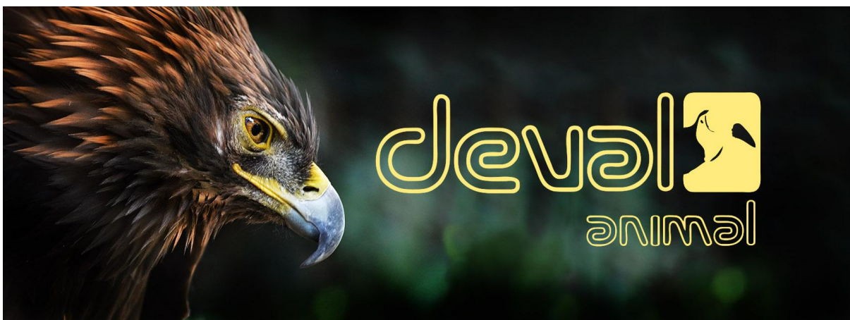
Publicaciones para redes sociales (Plantillas,Fotografía e Ilustración)