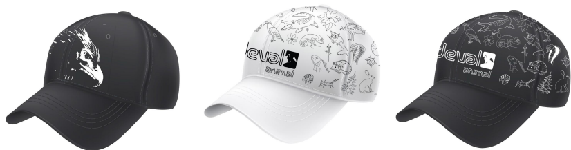
Diseño de promocionales