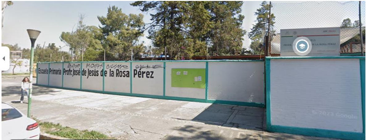
Fachada de la primaria “Prof. José de Jesús de la Rosa Pérez.