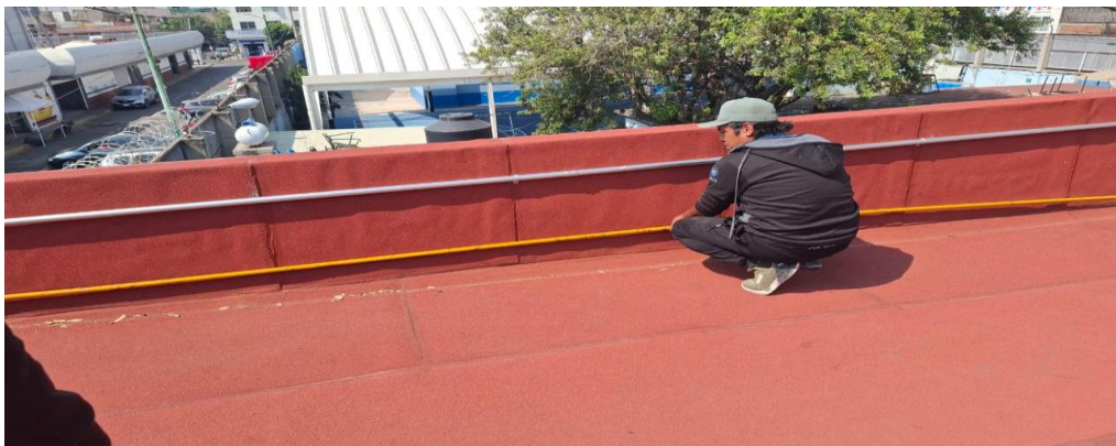
Visita al sitio en San Francisco Culhuacán (Foto tomada en sitio)