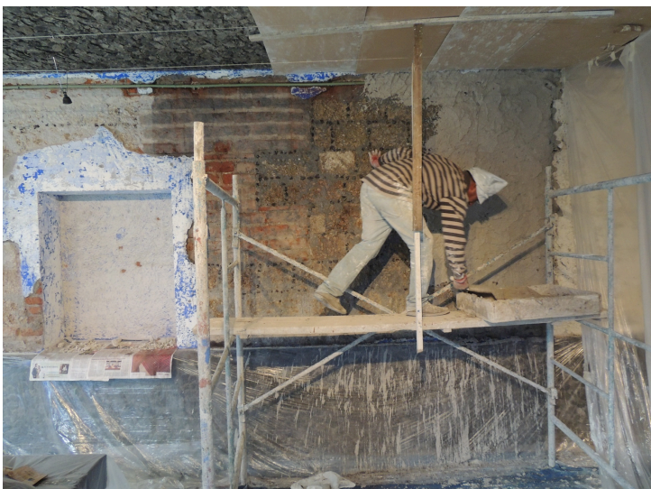
Aplicación en muro de capa de cal, agua y baba de nopal.