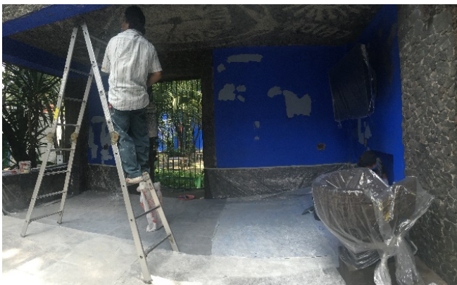
Retiro de aplanado en muro por donde se encuentra desprendido.