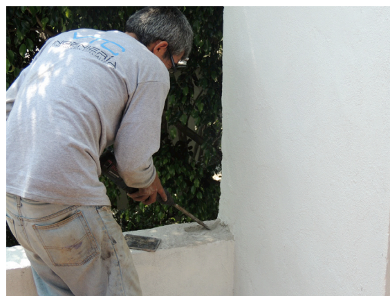
Demolición en pretil de azotea para colocación de placa de acero.