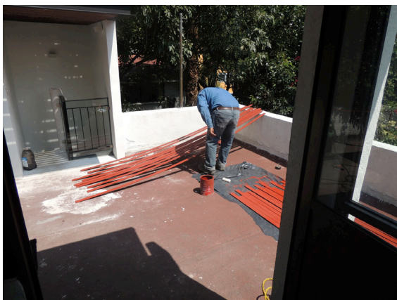
Aplicación de primario COMEX 100 en soleras.