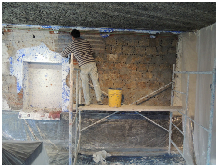
Preparación de muro, con sellador de baba de nopal para la colocación del aplanado.