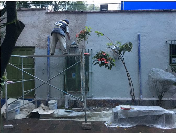
Aplicación en muro de sellador de baba de nopal.