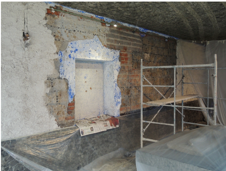
Sección área de trabajo en muro.