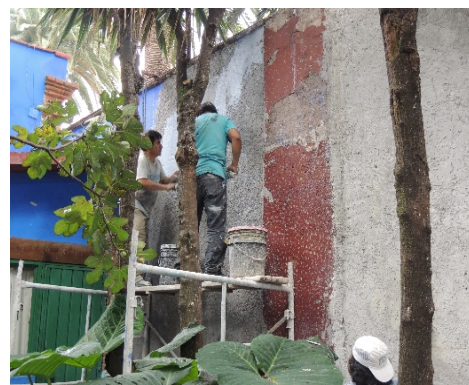
Aplicación en muro de sellador de baba de nopal.