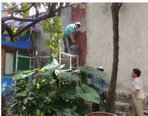
Aplicación de mezcla fina a muro.