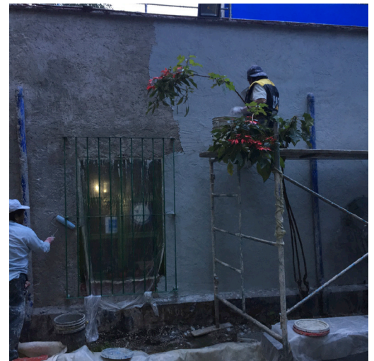
Aplicación en muro de agua más baba de nopal.