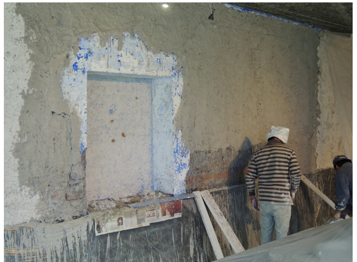
Colocación de ultima capa en muro de cal, agua y baba de nopal.