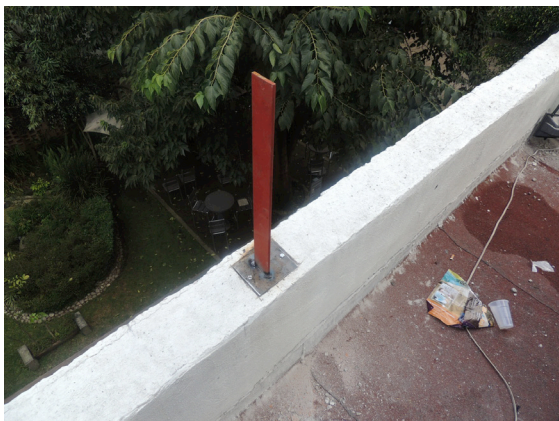
Colocación de soleras en placas con unión de soldadura.