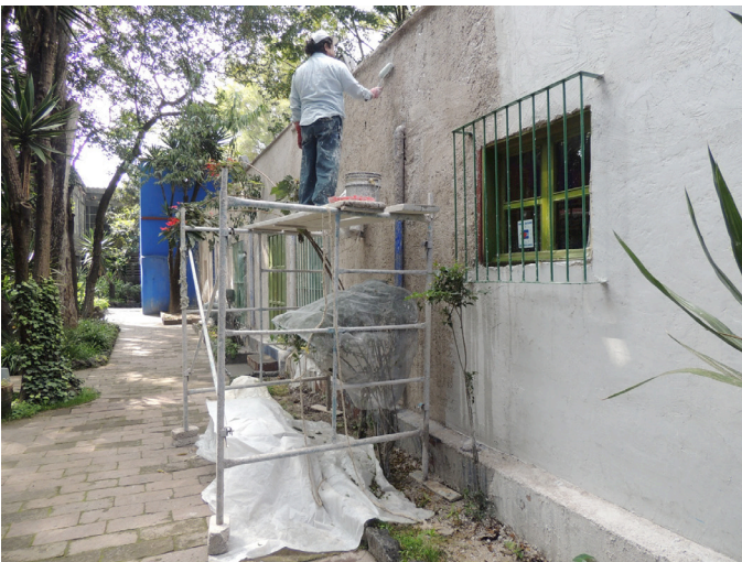
Aplicación en muro de agua más baba de nopal.