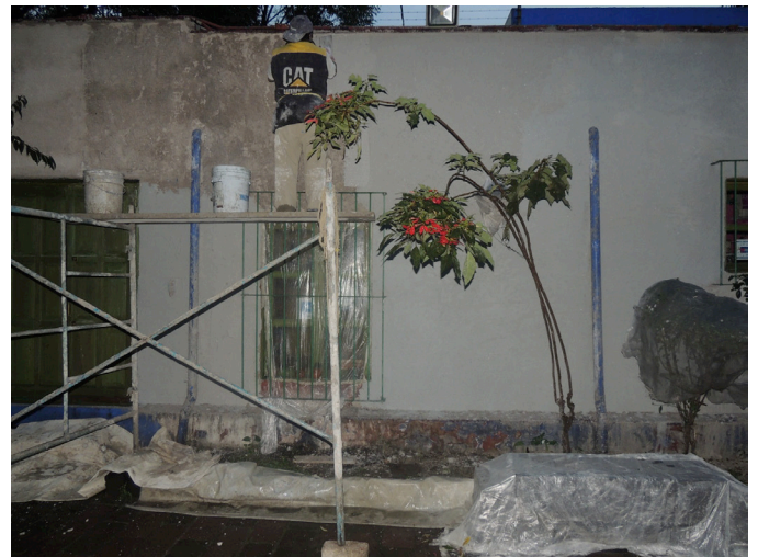
Aplicación en muro de sellador de baba de nopal.