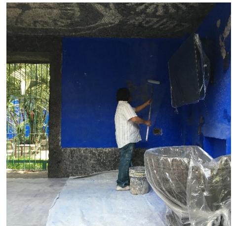
Colocación de pasta en huecos seguido de aplicación de sellador en