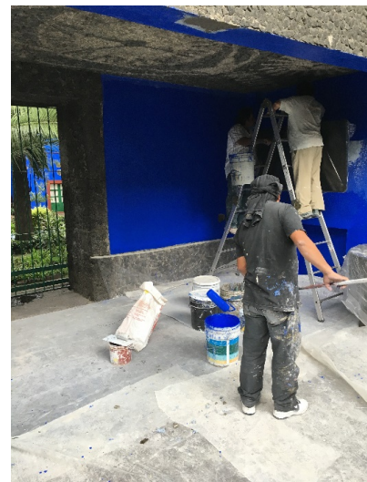
Colocación de pintura en muros.