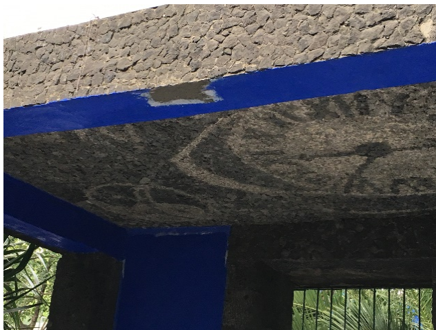
Colocación de cemento en parte de trabe por desprendimiento de aplanado.