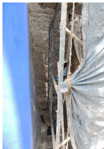
Aplicación en muro de capa de cal, agua y baba de nopal.