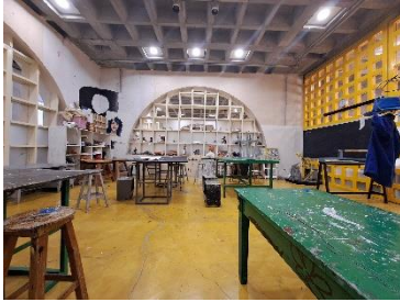
Taller 12 de producción