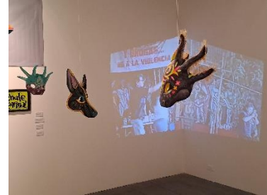
Parte de la exposición de la comunidad de Tepito.