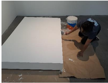
Reparación de mobiliario para la galería del edificio central.