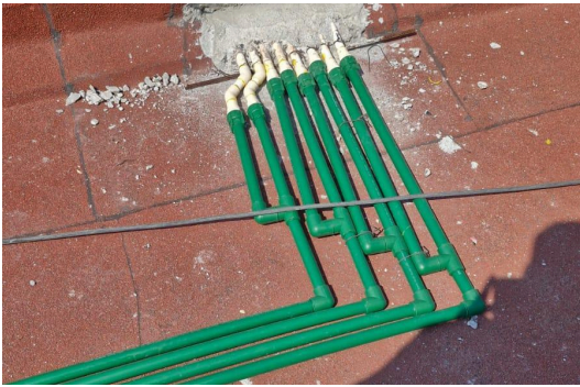
IMAGEN#10. Supervisión de instalación hidráulica en obra "Tlaxilacalli". (Residente de obra)