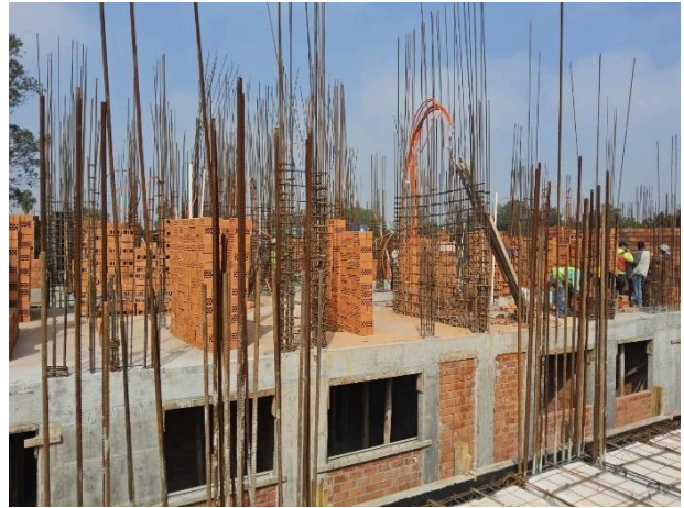
IMAGEN#9. Revisión de avance en pegado de block de segundo nivel. (Auxiliar de residencia)