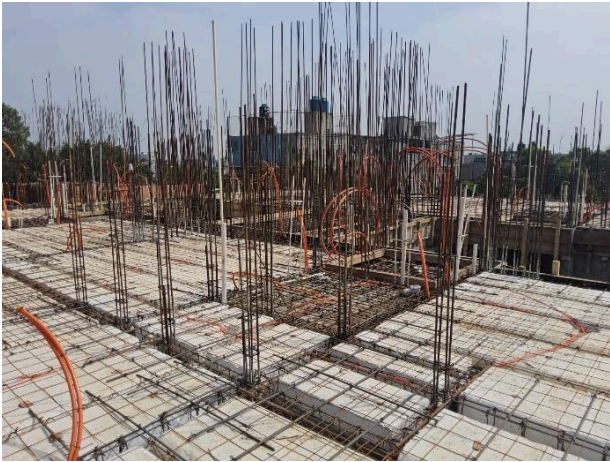
IMAGEN #8. Revisión de avance en armado de losa de entrepiso. (Auxiliar de residencia)