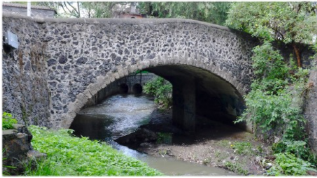
Ejemplo de captura fotográfica. Puente del Altillio, Coyoacán, Ciudad de México.

En mi estancia en el INAH solo me fue asignado un proyecto de captura fotográfica, se trató del Puente del Altillio que cruza el Río Magdalena y se localiza en la esquina de Avenida Universidad con Av Francisco Sosa en Coyoacán, junto al templo de San Antonio Panzacola. A pesar de solo haber realizado esta toma fotográfica, participé en múltiples proyectos de corrección de color y formato de las mismas.