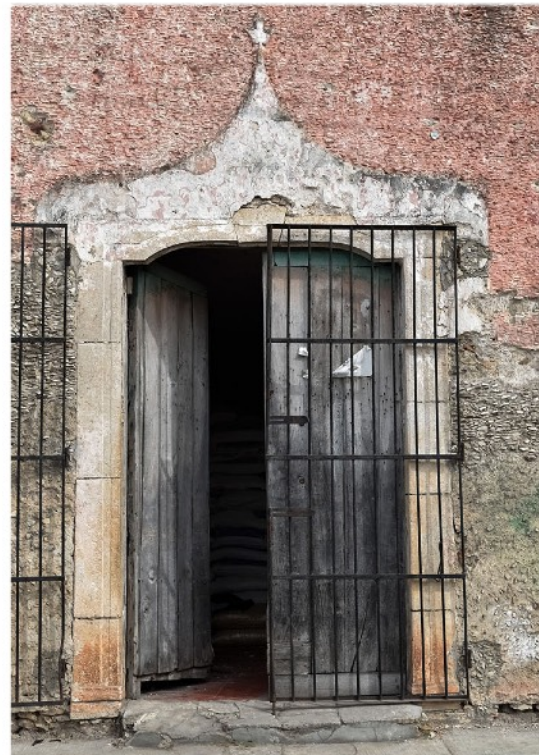
Ejemplo de edición fotográfica con varias imágenes en un solo lienzo. Detalle de puertas. Edificio de vivienda en Valladolid, Yucatán.