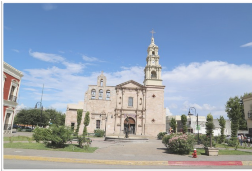
1.- Imagen original, tomada por el equipo que hizo el levantamiento.