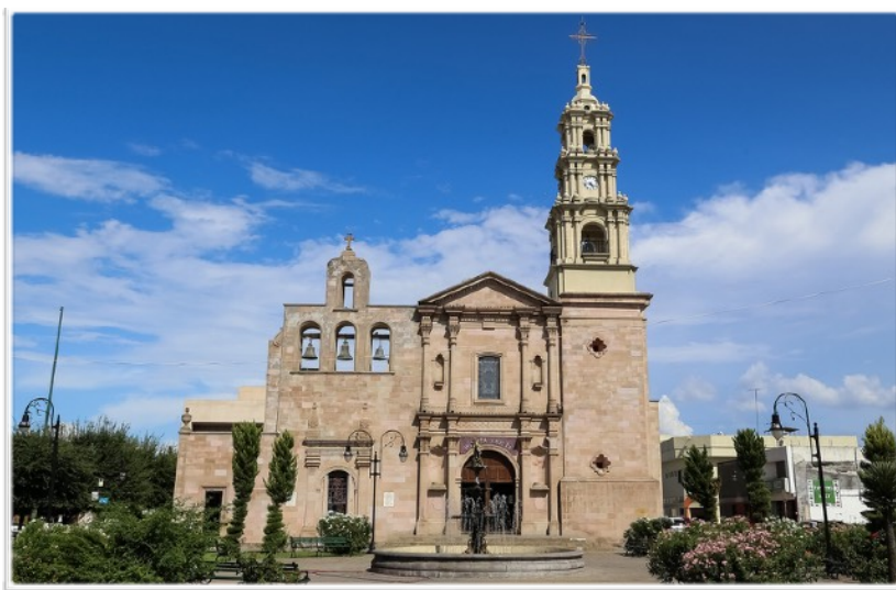
3.- Finalmente se adapta al formato del INAH (28x18cms) y se exporta a JPG para subirse al catálogo.