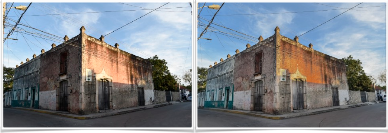
Ejemplo de edición fotográfica. Imagen original del lado izquierdo, imagen editada del lado derecho. Fachadas de vivienda en Valladolid, Yucatán.