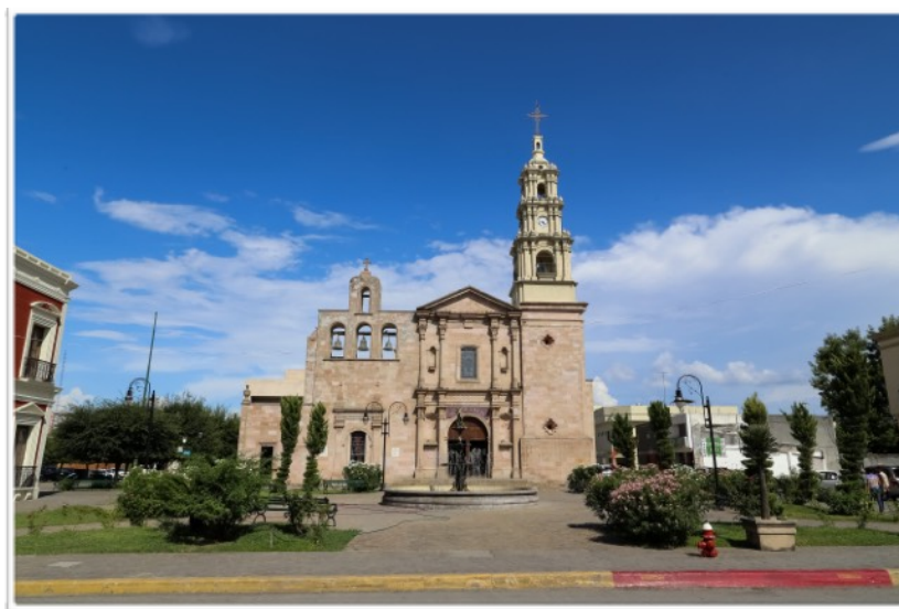
2.- Se corrige el color, aumentando el contraste para apreciar mejor el detalle. Se endereza la imagen y corrige la perspectiva.