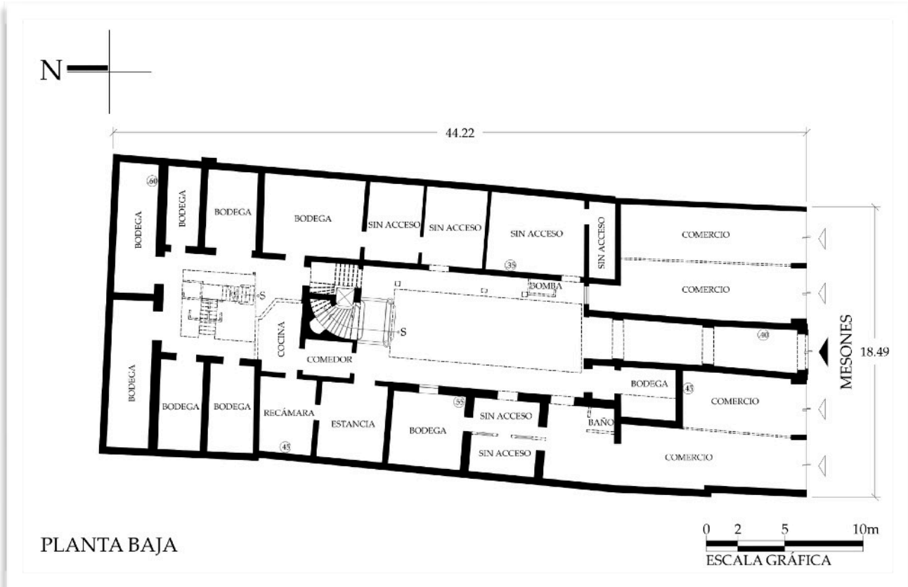
Ejemplo de dibujo plano arquitectónico con levantamiento en sitio. Inmueble de uso mixto localizado en la calle de Mesones #40. Centro Histórico de la Ciudad de México.