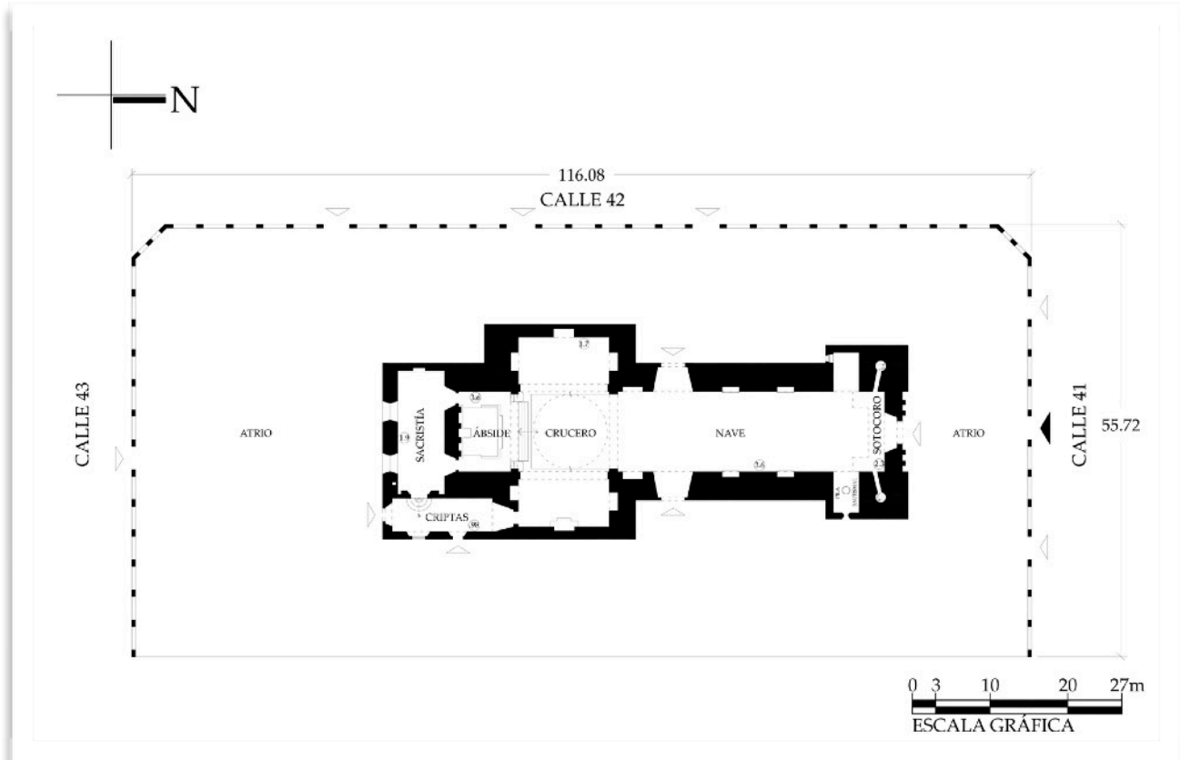
Ejemplo de plano arquitectónico a partir de levantamiento en hoja milimétrica. Catedral de San Gervasio, Valladolid, Yucatán.

realizar los levantamientos es solo para orientar al usuario del catalogo acerca de las características del inmueble, no es un plano de detalle ni de intervención.