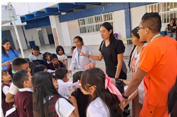
Ilustración 1: Feria de Salud en la Escuela Primaria Independencia Económica de México