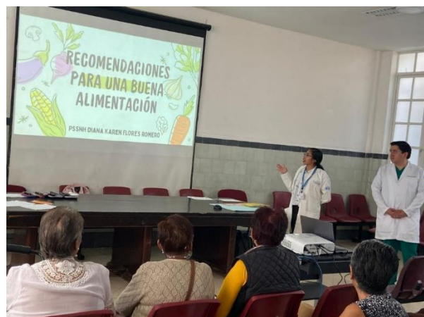
Ilustración 7: Exposición al grupo de adultos mayores para nuestro proyecto de intervención.