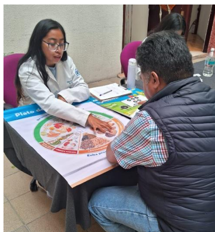
Ilustración 3: Feria de Salud en Auditoria Superior de la Ciudad de México