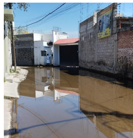
Ilustración 5: Censos en Caltongo por inundaciones