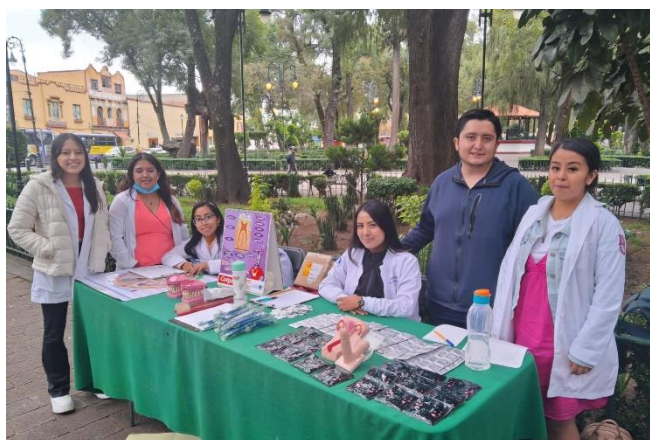
Ilustración 2: Feria de Salud en el Parque del Arte