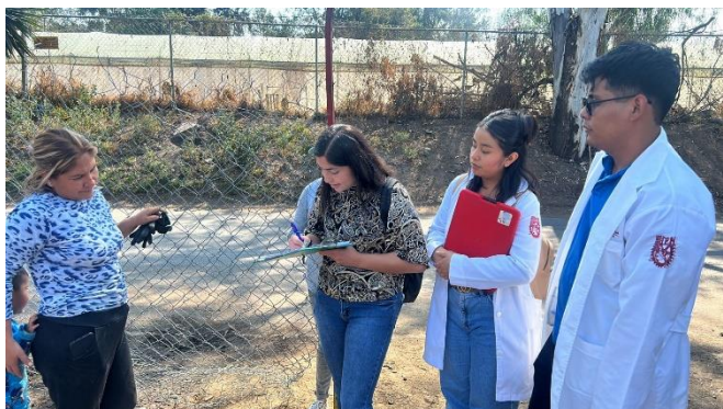
Ilustración 6: Aplicación de cédulas para el diagnóstico de Salud