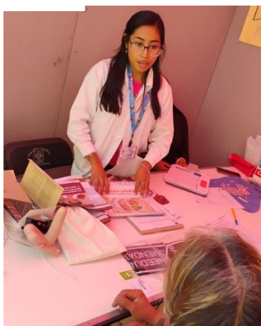
Ilustración 4: Feria de Salud en Gardenias