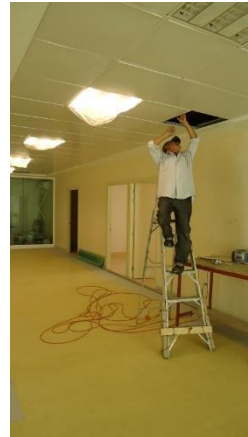
2._ instalación de luminarias en planta baja