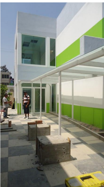
5._ Cubierta del andador que conecta ambas clínicas