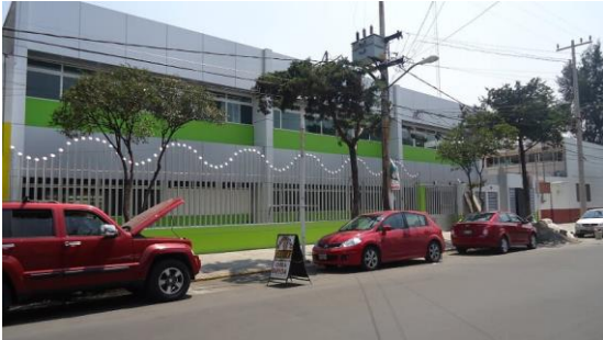
1._ Fachada de la clínica