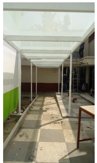
6._ perspectiva del andador con cubierta