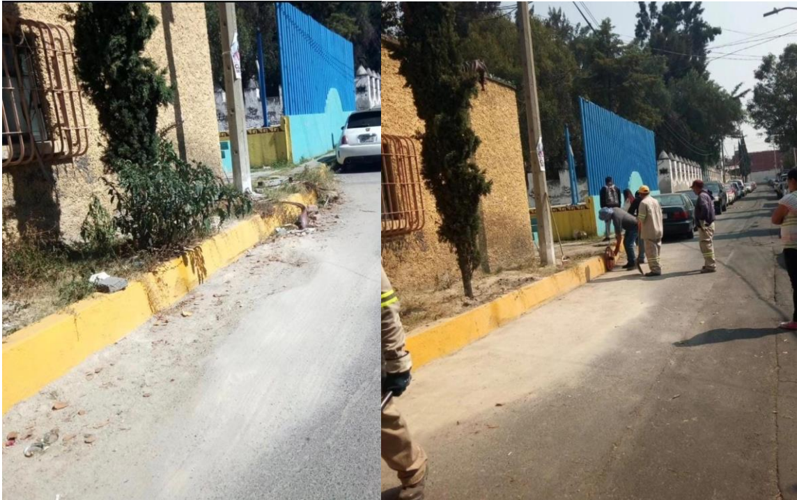
CAMBIO DE BANQUETAS EN EL PUEBLO DE MEXICALTZINGO