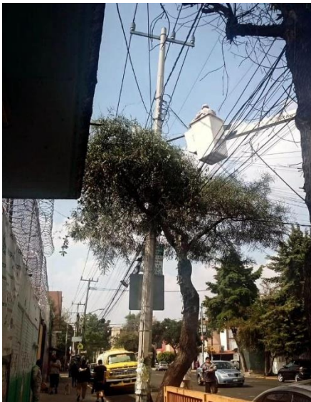
CAMBIO DE LUMINARIAS EN HEROES DE CHURUBUSCO