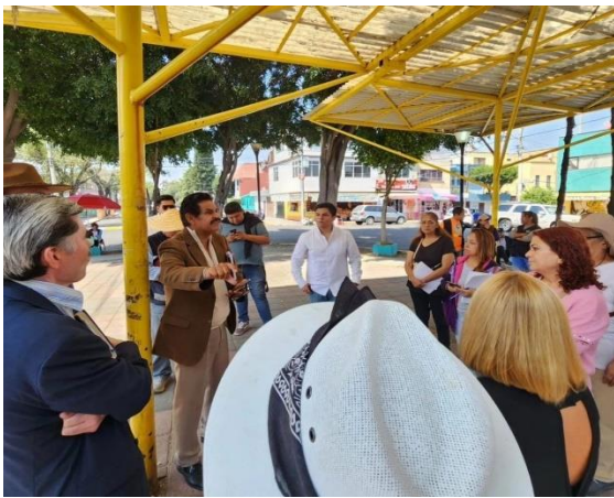
REUNIÓN CON DIRECCIÓN DE GOBIERNO, TERRITORIAL ACULCO Y VECINOS