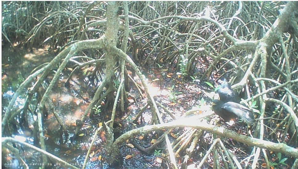
Figura 3. Individuo de aguililla negra mayor ( Buteogallus urubitinga ).

La información local coincide con registros obtenidos por cámaras trampa, que revelaron la presencia de organismos de interés ecológico, ya sea por su vulnerabilidad o por su escasa documentación científica. Dentro de este grupo destacan la aguililla negra mayor o de manglar ( Buteogallus urubitinga ) (Figura 3), el yaguarundí ( Herpailurus yagouaroundi ) —considerado el felino menos estudiado a nivel mundial—, y el tlacuache cuatroojos ( Philander opossum ) (Figura 4).