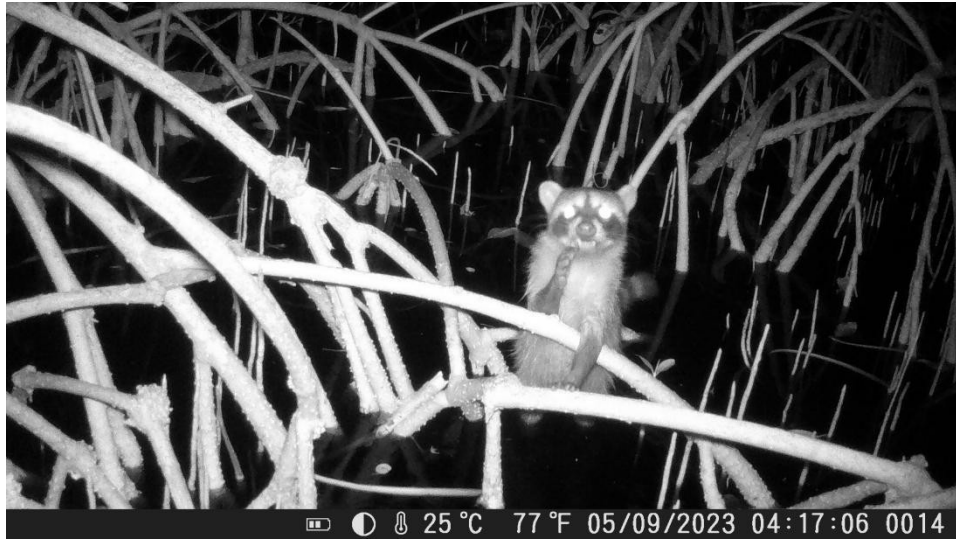
Figura 2. Individuo de Mapache ( Procyon lotor ).

Adicionalmente, en la zona colindante al cementerio del pueblo de Mandinga, se detectaron más indicios de fauna, además de información proporcionada por los pobladores locales (Tabla 1).