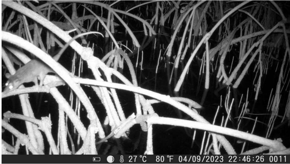
Figura 4. Individuo de tlacuache cuatro ojos ( Philander opossum ).