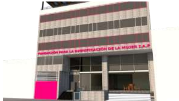
2. 3D de la propuesta de Fachada de la Fundación para la Dignificación de la Mujer.