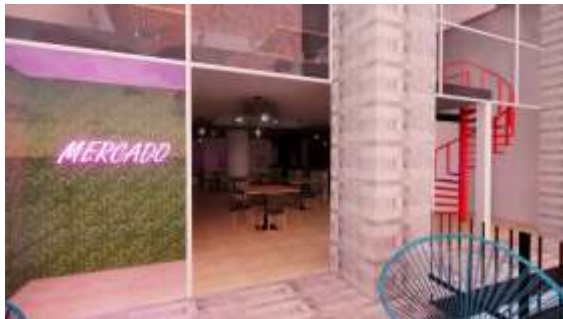
5. 3D de la propuesta seleccionada de locales.