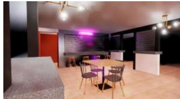
6. 3D de la propuesta seleccionada de locales.