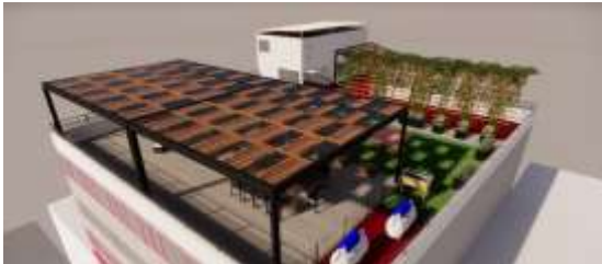
3. 3D de una de las propuestas de la azotea de la Fundación para la Dignificación de la Mujer.