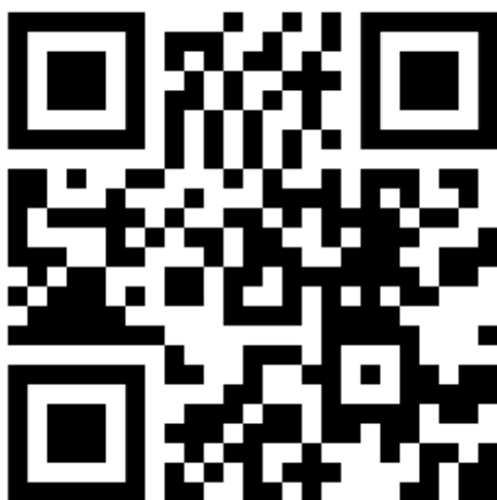
Anexo 5: Enlace a una de las cápsulas del proyecto “¿De qué va el PCI?”