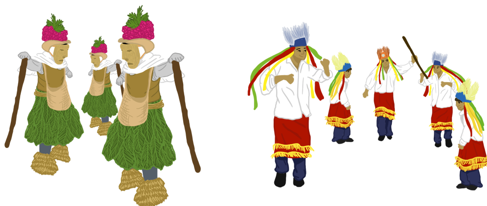
Anexo 2: Ilustraciones para las cápsulas informativas del proyecto “¿De qué va el PCI?”. Izq.: Ilustración representando la “Danza del Pocho”, baile tradicional del Carnaval de Tenosique, Tabasco. Der.: Ilustración representando la “Fiesta del Mitote”, tradición de los Coras.