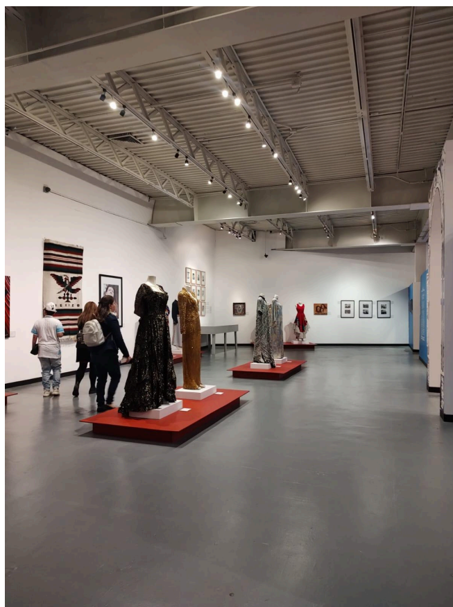
Anexo 3: Exposición “La Caravana. “Ídolos del pueblo”, Museo Nacional de Culturas Populares.