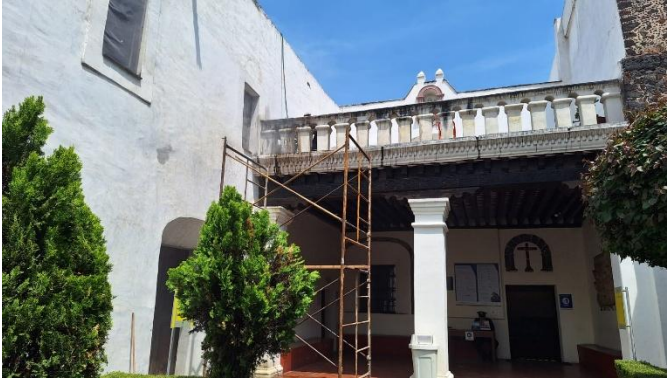
Imagen 1 Balcón del vest. principal.