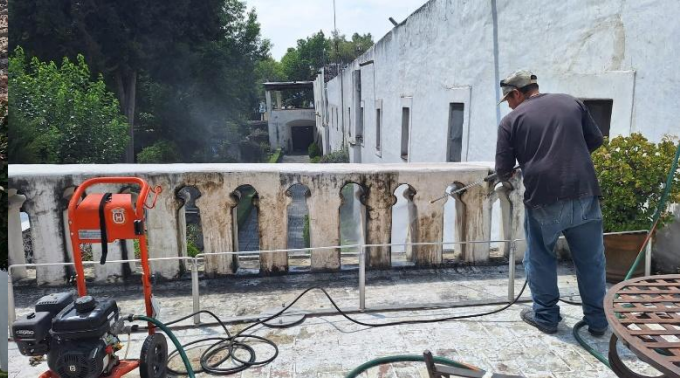
Imagen 2 Balcón del vest. principal. Hernández, J., 2024