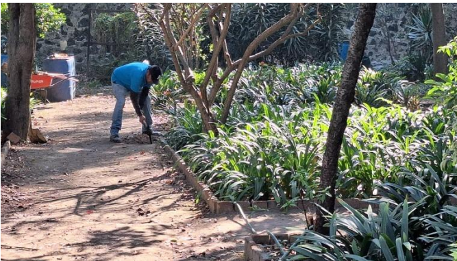
Imagen 5 Reparación de tuberías Hernández, J., 2024