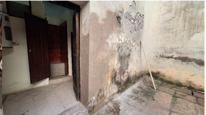
Imagen 4 Aplanado de muro Hernández, J., 2024