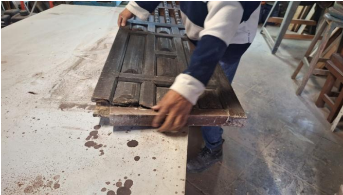
Imagen 3 Reparación de puerta. Hernández, J., 2024