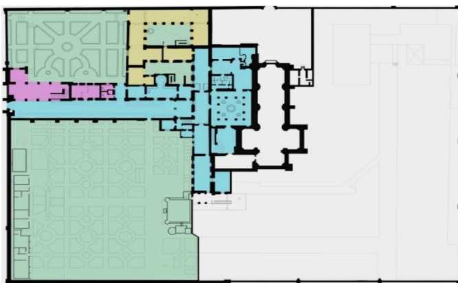
Imagen 7 Plano arquitectónico en Photoshop Hernández, J., 2024