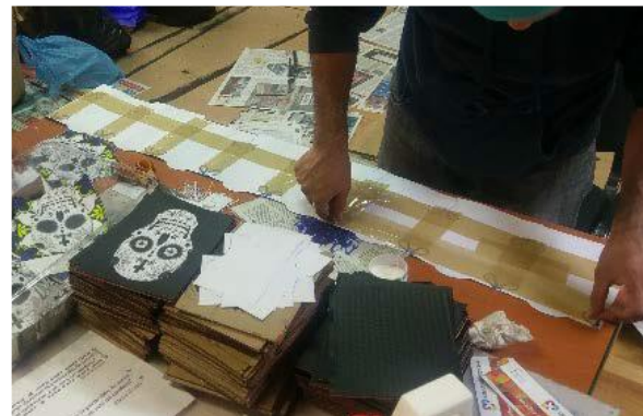
Elaboración de cuadros para Tzompantli.