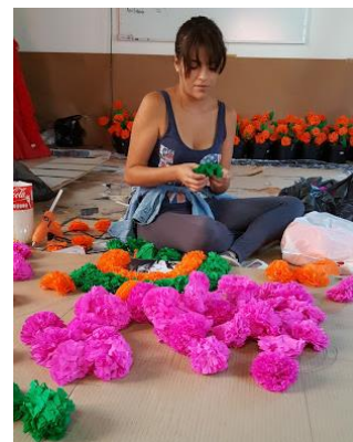
Elaboración de flores de cempaxúchitl en papel.