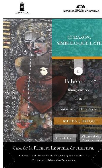
Cartel corazón símbolo que late.