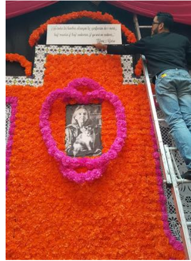
Montaje marco de la puerta y retablo.