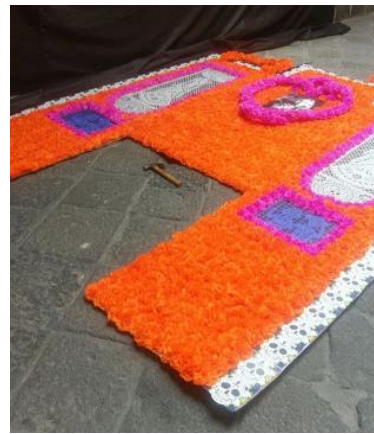
Elaboración de arcos y retablo.