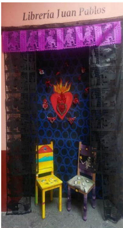
Colocación de muro de corazón.