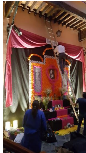
Previo a la inauguración