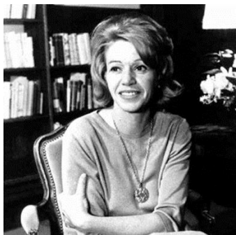
ELENA GARRO (1920-1998)

La escritora Elena Garro es la protagonista de la ofrenda del 2016, escritora mexicana precursora del realismo mágico y esposa de Octavio paz, fallecida el 22 de agosto de 1998.