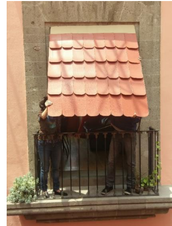
Elaboración de tejados de cartón.