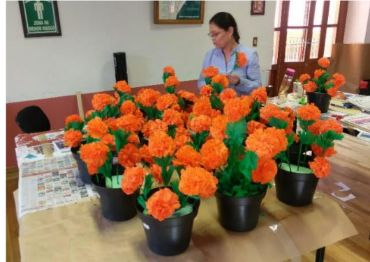
Armado de macetas con flor de cempaxúchitl.