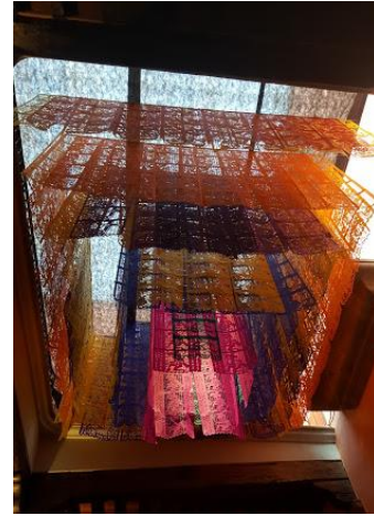
Colocación de cascada de papel picado.