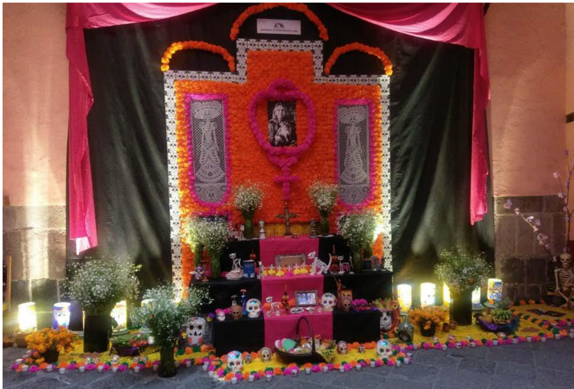
Montaje Final Escaleras y Ofrendas.