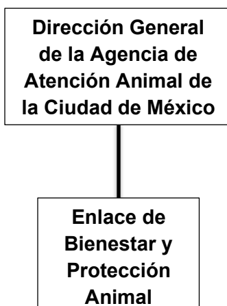
Esquema 1. Organigrama de la Agencia de Atención Animal.