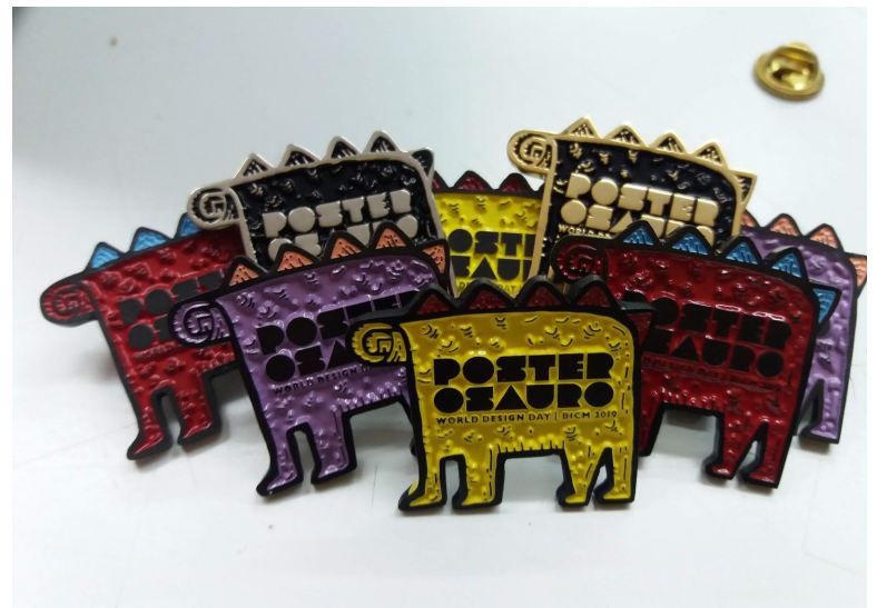
Catálogo 15 BICM