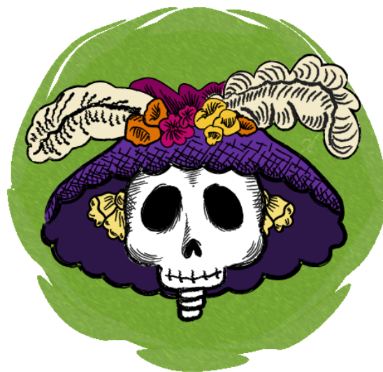
Jules cheret / Calavera Garbancera