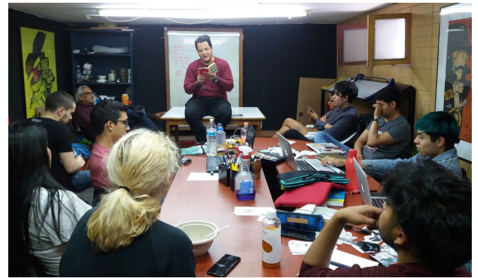
Clausura BICM en Franz Mayer / Colectivo Sótano Roma en clase muestra