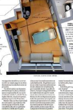
Es cuarto de hospital nueva frontera en diseño

La mejora del entorno urbano en México requiere un esfuerzo conjunto.