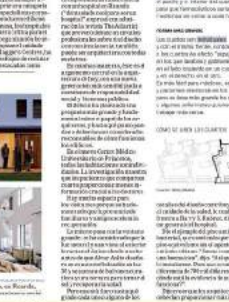
Exposición en el Museo Franz Mayer

Durante la exposición se podrá apreciar el pasado del rebobo, su frágil presente y cómo preservarlo.